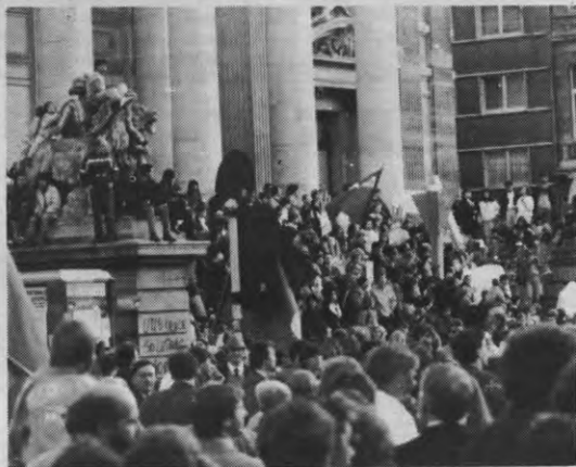
De vredesoptocht vorige zondag was weerom een sukses tegen de verwachtingen in. En ook op de sfeer stond weer geen rem.