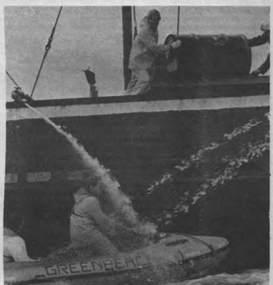
Zoals altijd tussen bedreiger en bedreigde. U kan Greenpeace altijd steunen; door storting van 400 fr (200 voor studenten) op rekening 001-1293159-31.

Zo beweegt 'De Tuin' zich op het boeiende niemandsland tussen dans en teater: langzaam maakt de danseres zich in het begin van de voorstelling los van de achterwand van het podium om schoorvoetend, bijna tastend de tuin van haar jeugd te betreden. Eens in die tuin — in het licht van de spots — ontvouwt zich het verhaal van haar leven. De rest van de koreografie is zonder twijfel verhalend en zelfs autobiografisch, maar door de vaagheid van de verwijzingen naar plaats en tijd kan de toeschouwer invullen wat hij zelf wil. De nogal zeldzame momenten van geluk op het podium (het kijken naar de vlinders, luisteren naar een kabbeldend beekje...) worden ook mo-