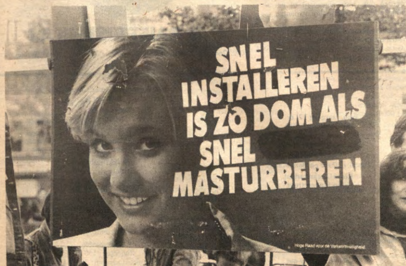
Deze hebben we echt niet getrukeerd. Er werden trouwens nog heel wat andere ludieke en minder ludieke borden en spandoeken meegesleurd op de vredesbetoging van 20 oktober in Brussel. Opvallende afwezigen op de manifestatie: de Leuvense kringen.

Alle geïnteresseerden en in het bijzonder alle onderwijsverantwoordelijken worden hartelijk uitgenodigd. □