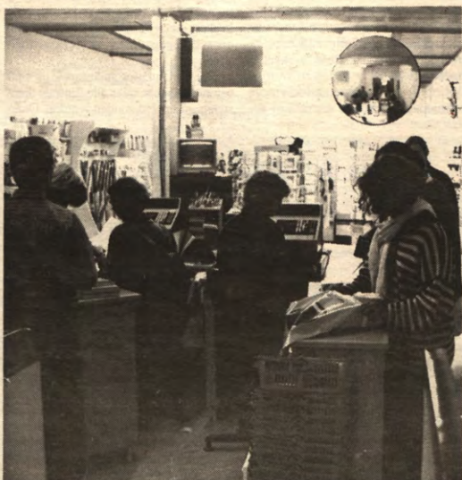
KASSA Het imago van Acco loopt bij de belangrijkste doelgroep, de studenten, gevaar door een prijsstijging.

Volgens de studentenfractie loopt ook het imago van Acco bij de belangrijkste doelgroep, de studenten, gevaar door