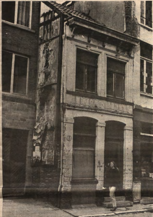
ZWARTE LIJST - Deze week in Veto: een tip van de vuzinge sluijer wordt opgelicht! Krotten van koten, kamers naast dansings, treiterige kotbazen, lastige paters en meer van dat moois... Misschien zit jouw kot er ook wel tussen: neem snel de lift naar pagina 3.

STUDENTENWEEKBLAD VAN DE LEUVENSE OVERKOEPELENDE KRINGORGANISATIE - JAARGANG 17, 1990-1991, NUMMER 30, DINSDAG 21 MEI 1991