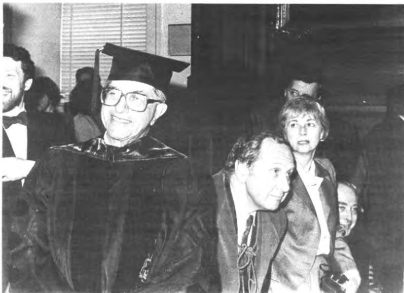
AU SUIVANT... Eredoktoraten! Ze krijgen er maar niet genoeg van aan de KUL. Ditmaal was, voor de fakulteit ekonomie, professor Merton H. Miller van de University of Chicago aan de beurt. Het eredoktoraat werd hem toegekend omwille van zijn omvangrijke prestaties op economisch gebied, vooral dan in samenwerking met Modigliani (recent nobelprijswinnaar).