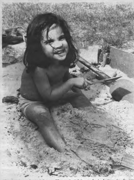
Het kind in de inrichting. Hoezo inrichting, als je buiten in de zon lekker in het zand kan spelen?