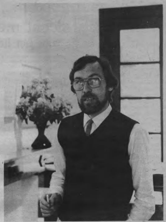
De galerij Perspectief in de Dekenstraat wil kansen bieden aan kunstenaars die in het normale kunstcirkuit niet aan bod komen. Zo loopt er binnen afzienbare tijd een tentoonstelling die de moeite van het bekijken waard is van een 76-jarige man.

Galerij Perspectief Dekenstraat 49 3000 Leuven 016/22 79 14