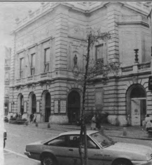
Stadsschouwburg: tempel van gekleurde klungelaars

Dit deficit zal echter ook enkele merkbare gevolgen hebben. Zo zal men moeten putten uit de hernieuwingsprovisie om het meest nijpende tekort aan te zuiveren. Ook zal men