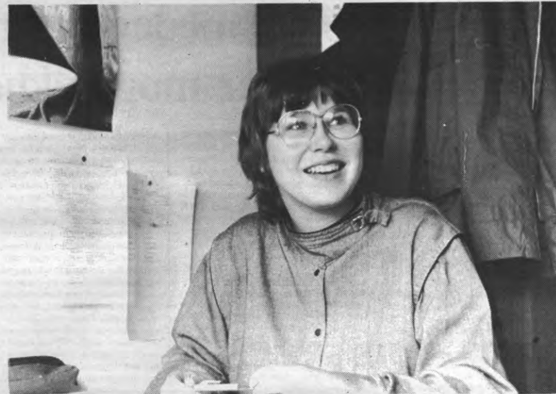
Preses Caroline: veel aandacht besteden aan ekskursies, en we zijn weer vertrokken voor een jaar. In de lijn van de traditie, met eventueel toch wat nieuwe aspecten te ontdekken via een enquête.

Na dit ellenlange voorspel, kon dan eindelijk naar het 'moment suprême' gestreefd worden: een al dan niet liefkozende aai over de nieuwe kandidaat-kaartkoplopers.