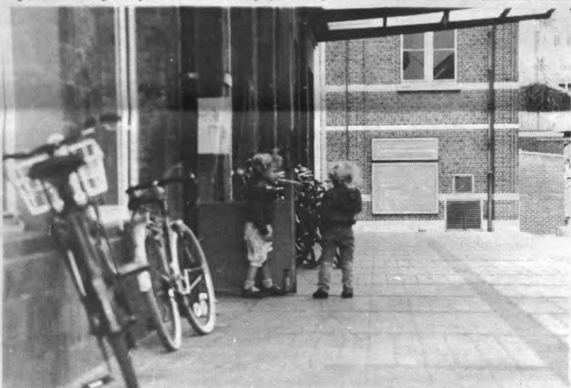
't Stuc: hoelang nog cultuurcentrum, als het ministerie de dossiers van het kastje naar de muur blijft sturen