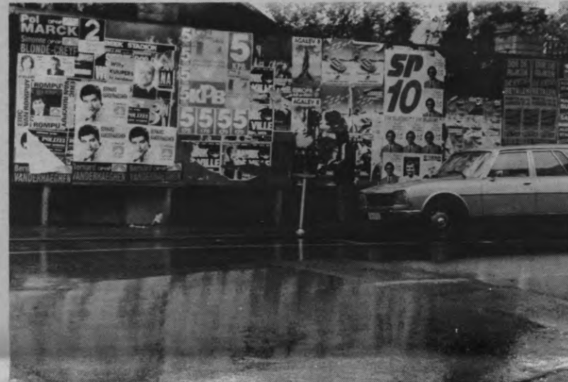
De hout nijverheid lijkt de eerste te zijn die de positieve gevolgen ervaart van de verkiezingen. Alhoewel, insiders beweren dat de borden gerecycled werden uit vorige verkiezingscampagnes.

PS: Wij wensen er nog eens de nadruk op te leggen dat alle partijen die zich kandidaat stellen bij de Europese verkiezingen uitgenodigd werden om hun verkiezingsprogramma op te stellen. Van de partijen die in dit overzicht niet aan bod komen, hebben wij niets ontvangen.