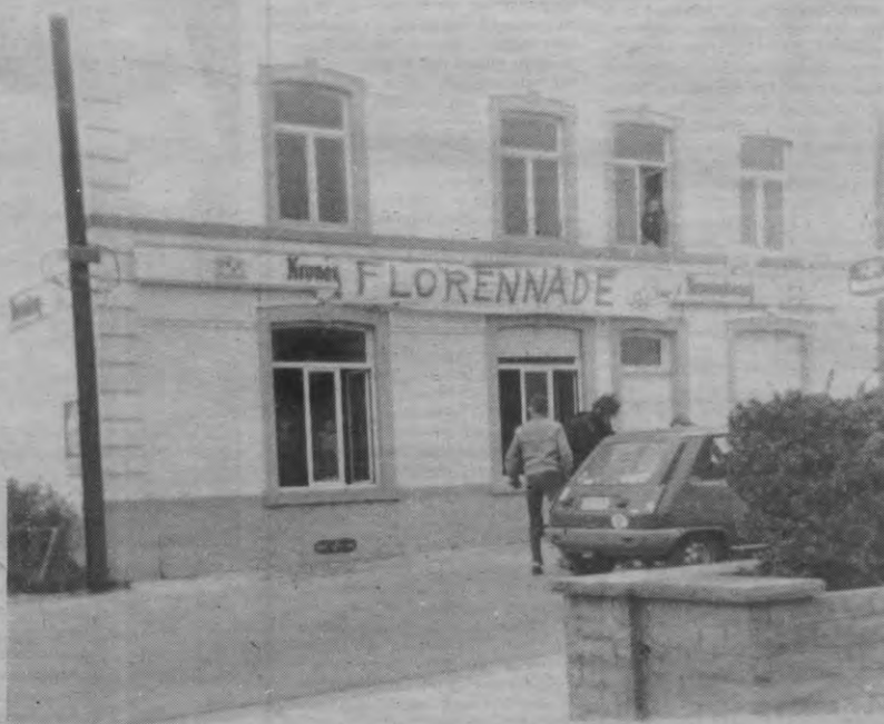
Vredeskaffee. Okee, maar dan ver weg van elke militaire basis... zegt de rijkswacht.

Wie kontakt wil opnemen met de vzw Florennade kan dit doen via Tiensevest 118, 3000 Leuven. Wie financieel wil steunen, kan een storting doen op naam van het Anti-Rakettenfonds, 001-1357929-05.