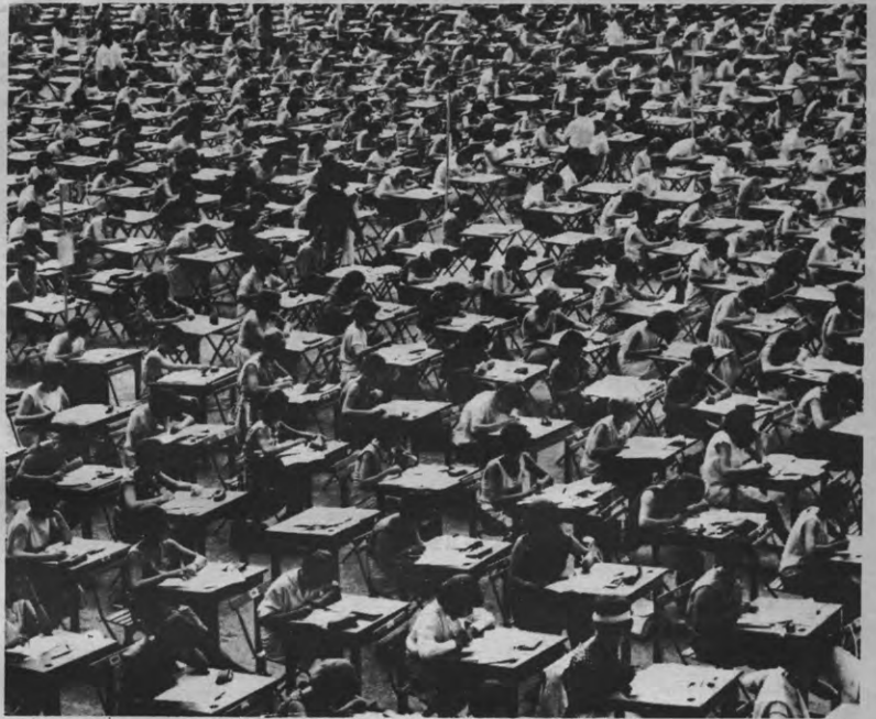
Heb jij ook binnenkort examens? Wij zien je terug in oktober... als je dit overleeft tenminste.

Van beleid of visie was er geen sprake: enkel de sociale ploeg had enige ervaring met ASR-werking en bood een degelijk programma aan; ook de kandidaten voor de POK verklaarden te willen meewerken aan de Kringraad. Hopelijk vinden zij vanuit het presidium genoeg steun om 'n wat ruimere werking uit te bouwen.