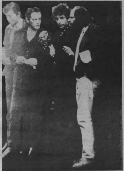
Rechts op de foto slaat Allen Ginsberg een praatje met Bob Dylan.

Veto: Do you think music can fortify the meaning of lines?