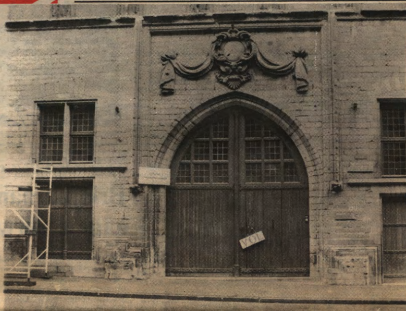
Ook aan de universiteit kan men met rationaliseren alle kanten op...

En dan is er ook nog de herhaalde heibel van diverse beroepsorganisaties