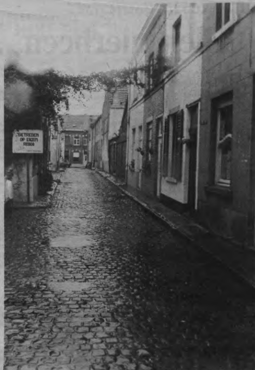
Het eventueel wegvallen het buurtwerk zal zeker voor minder leven in de buurt zorgen.

(*) Luc BALTUSSEN, Raden weigeren vrijgestelde af te staan aan Sportraad, ibidem, p. 1 en 7.