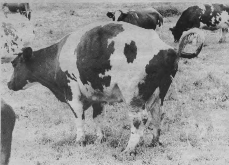
Teveel studenten veartsenij voor een landje met zo weinig echte beesten... volgens de dekaan van diergeneeskunde.

maart schreven zij, fier als een haan op een mestvaalt, een briefje naar de rektor dat de buitenlandse studenten zo uit hun bek stonken dat zij het initiatief van de bronstige bok ernstig belemmerden tijdens de voorstelling "waar de kleine geitjes vandaan komen". Dit soort studenten moest diskreet verwijderd worden. Een heuse enquete had dit aangetoond.