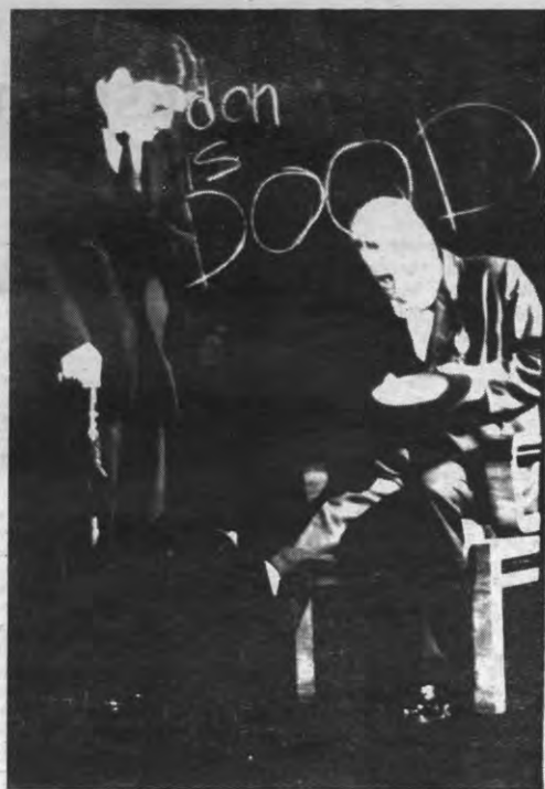
Strange Interludes: een dodendans waarin onze recensent de pas niet kon houden.