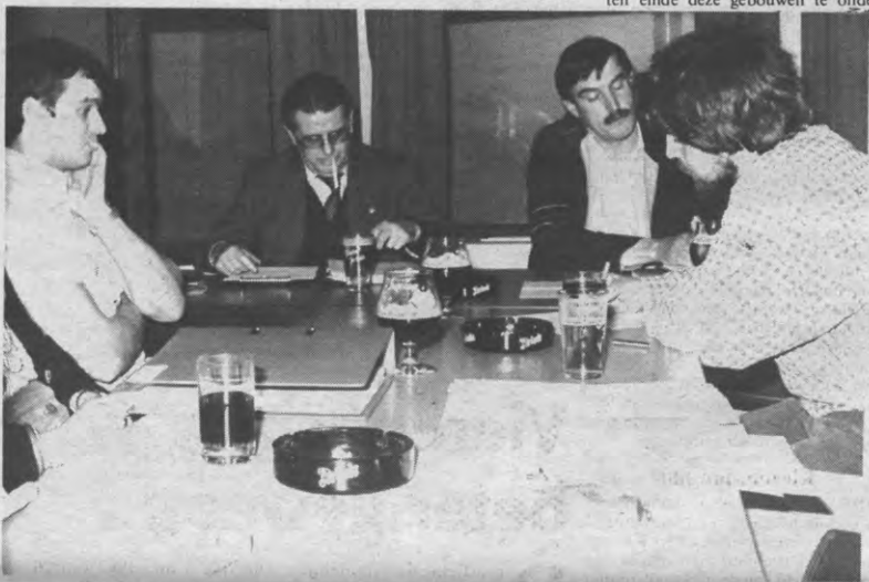
Dit zijn vakbondslieden. Maar zeg nu zelf. Zou het niet even goed een patronale afvaardiging kunnen zijn?