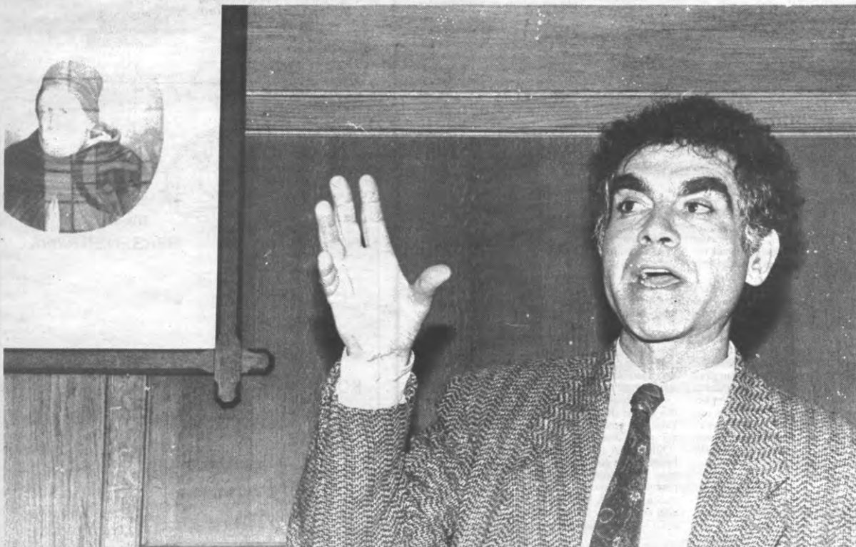
'De goede historicus maakt van zijn lezer een toeschouwer'. En van zijn vrouw?.