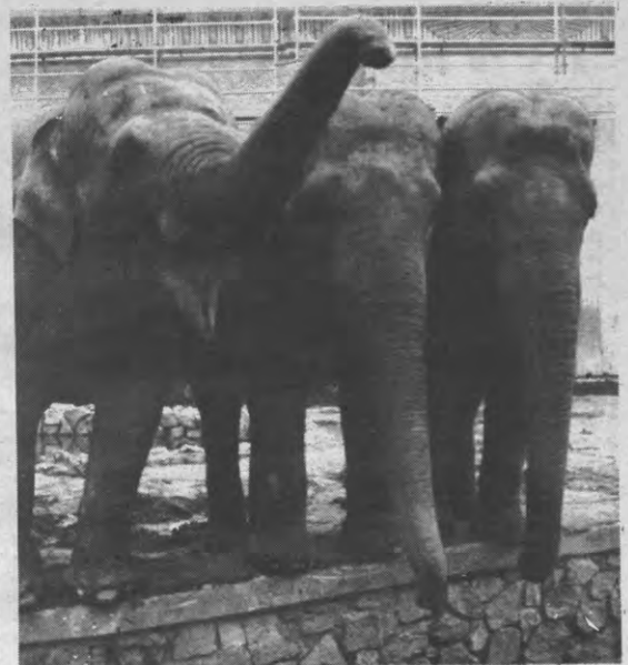
The good, the bad and the ugly. Wie wordt preses. Aan u de keuze.

Vervolgens komt de eigenlijke stemming. Per functie dienen drie stappen ondernomen: eerst wordt ze voorgesteld door de huidige verantwoord-