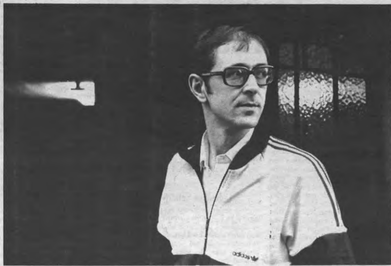
Elk jaar larsen euperfriman morto nolson birg. Er jensen bry llekennet. Puma, puma, puma!