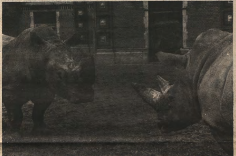
KRINGVERKIEZINGEN — Het is toch godgeklagd dat deze twee beesten op een zo goddeloze manier met elkaar hun problemen moeten uitpraten. Neen, geef ons dan maar de kringverkiezingen bij Landbouw, Godsdienstwetenschappen en Psychologie. Daar ging het er soms menselijk aan toe, zie pagina 3.

Omdat wij ook wel weten welke rubrieken bij ons kieskeurig lezerspubliek het meest in de smaak vallen, besteden wij volgende week eens extra aandacht aan ons welgemaakte fenomeen Zoekertjes. Slechte zoekertjes, goede zoekertjes, zeer geleerde zoekertjes en oerdomme zoekertjes: ze komen er allemaal in. En natuurlijk mag u weer eens een gooi doen naar de titel!