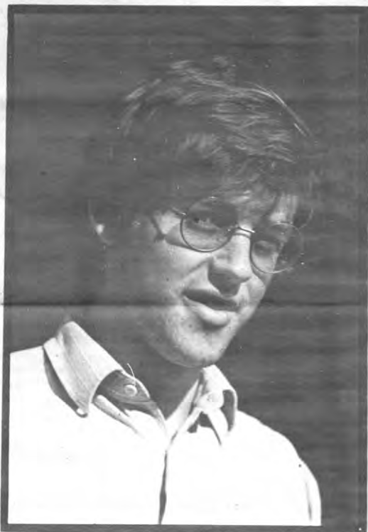
Alles wat wij op de Akademische Raad bepleiten is in feite bestemd voor dovemansoren.