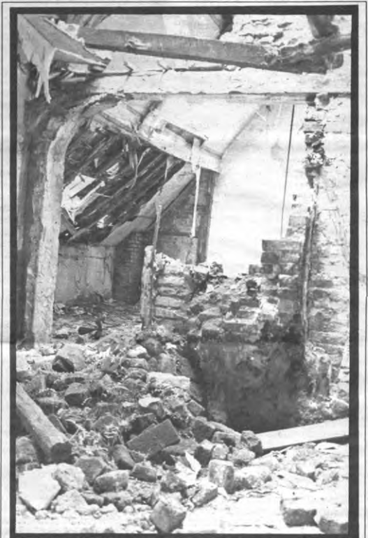
Stop de verkrotting.