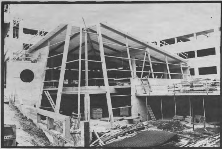
Nieuwe gebouwen kraken, vanaf nu bij Sociale Raad.

De studenten waren verbolgen over deze gang van zaken en besloten tot actie over te gaan. Zondagocht drongen ze binnen in de bouwwerf