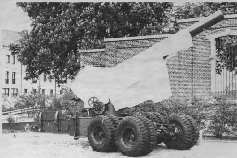
In de nacht van zondag 28 op maandag 29 april bedekten leden van Gerold in zes steden militairistische monumenten. Hun aktie kreeg nauwelijks weerklank in de pers.