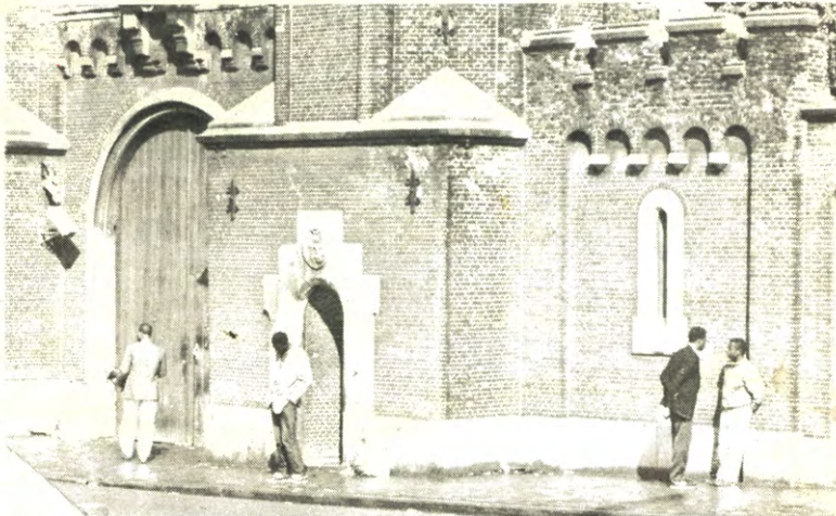
"Op het commissariaat-generaal is er momenteel een achterstand van 15.000 dossiers."

Daar is dan niets aan te doen. Maar intussen zullen we toch heel wat doelpotten geopend, smeulende brandjes versneld, en wat met de toga der liefde bedekt was, blootgesteld hebben. En dat allemaal op kosten van de adverteerders (p.2,3,5,7) en met subsidies natuurlijk (de rest). Jaja, we zijn uitgekookte jongens (allemaal). En moordgrieten (de rest).