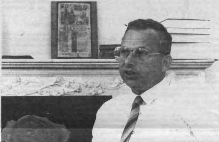
«Uit onderzoek blijkt dat meer dan drie vierden van de afgestudeerden naast hun basisdiploma één of meerdere opleidingen volgen.»

Veto: Gaat men dan vooral kiezen voor bedrijfsgerichte postgraduatoren?