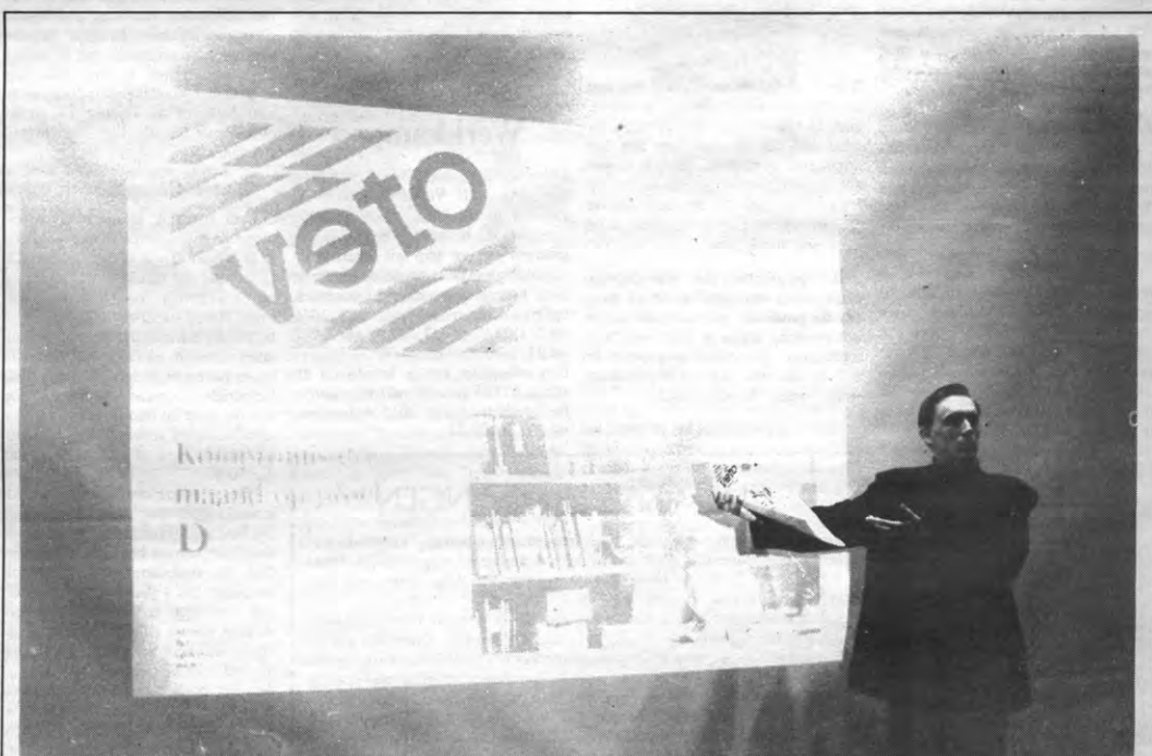
TOT DE TE BLOKKEN STOF hoort dit jaar ook Veto. Veto is het blad van de Leuvense studenten dat gedurende het academiejaar wekelijks in mekaar gebokst wordt door een frisse groep vrijwilligers. Wekelijks babbelen zij samen op de redaktievergadering en wekelijks tikken, knippen en plakken zij hun produkt bijeen op de lay-out. Het resultaat ziet u hier. Maar bij dit resultaat moet u één ding goed voor ogen houden: voor een degelijke Veto zijn degelijke vrijwilligers nodig. Als je geen oven bent, kan je je dus gaan aanmelden op de 's Meiersstraat 5, alwaar dat volkje gehuisvest is. Je kan bij Veto terecht als schrijver, als lay-outer, als fotograaf of als fotozetter. Let wel: geen enkele ervaring is vereist, enkel een flinke dosis gezond verstand (en de juiste partijkaart natuurlijk...)

Geïnteresseerde studenten dienen hun kandidatuur in, schriftelijk, met een motivering en een c.v. met de voor het mandaat belangrijke ervaringen, uiterlijk op woensdag 18 mei om 17.00 uur op Kringraad, 's Meiersstraat 5, 3000 Leuven. Voor meer inlichtingen kan men op hetzelfde adres terecht. De kandidaten dienen zich als uitgenodigd te beschouwen voor de verkiezings-AV van Kringraad op vrijdag 20 mei om 20.00 in de 's Meiersstraat 5.