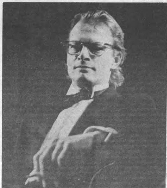
Dit heerschap pleegt wel eens een volstrekt willekeurig woordenkleedje te weven; Maar wanneer hij dat dan gaat registreren wordt het resultaat plots iets heel anders. Pick-Up, om maar één voorbeeld te noemen.