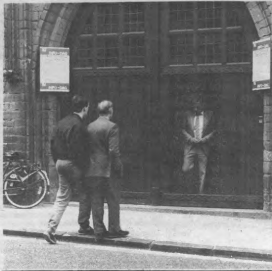
INSCHRIJVINGEN — Het belang indachtig van een degelijke vorming, ook op gevorderde leeftijd, worden er steeds oudere heerschappen gesignaleerd aan deze universiteit. Vergrijzing alom, en dan zijn deze kerels niet eens afgestudeerd.

Juist, maar ook het intrappen van een open deur. Reeds vele jaren zorgen met name te Leuven het Instituut voor Literatuurwetenschap (theoretisch) en de Universitaire Werkgroep Literatuur (meer praktisch, in 's Stuc) voor