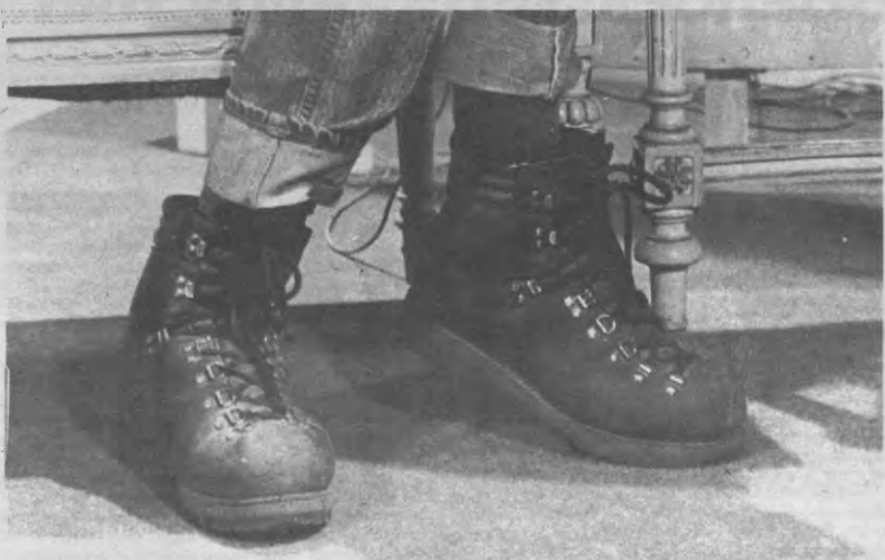
Dit alleen maar om u een idee te geven van de subtiliteit van het nieuwe Wina-presidium, (Foto Jeroen Revalk)

Het was eigenlijk niet voorzien, maar na aandringen van iemand uit het publiek, werd dan toch de kans