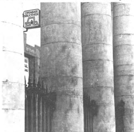
Deze foto was mooier voor de lay-out...

Video. Ma 11, wo 13, ma 18 en di 19 mei in de Vlamingenstraat 83. Met onder andere video's van Jean-Luc Godard, Peter Greenaway en John Adams. Voor details: zie Agenda.