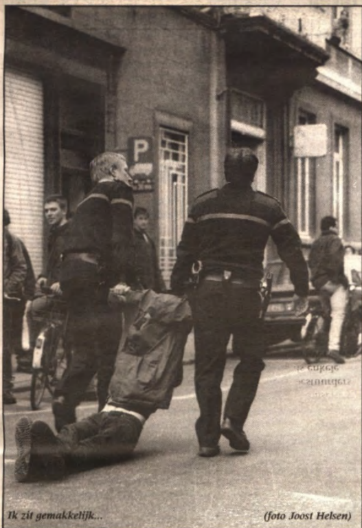
Ik zit gemakkelijk...

len, werd echter niet duidelijk. De manier waarop de agenten controleerden was dan ook nogal geïnproviseerd: ze controleerden bijvoorbeeld of een fietser het sleutelcijf bij zich had om het bij de fiets horende fiets-slot open te doen. Iemand die beweerde een fiets geleend te hebben van een vriend moest adres en telefoonnummer van de persoon in kwestie opgeven. Op de vraag of