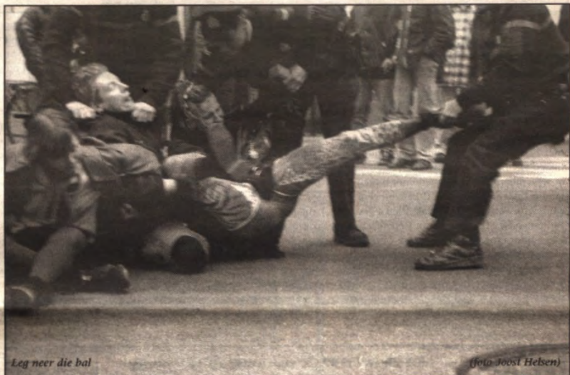
Leg neer die bal

kontraproduktief: nieuwsgierige toeschouwers scharden zich achter de aktievoerders en in plaats van minder stond er plots meer volk op het kruispunt. Vooral het snelle bovenhalen van de matrak door een norse agent, die niet bereid was om met de politievoerder van de betogers te onderhandelen, zorgde voor verontwaardiging alom. Ook hier kwam de gebrekkige infor-