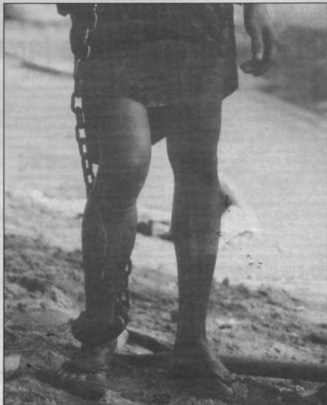
Eén van de Birmezen die het slachtoffer is van de chain gang.

Hoewel Total en Unocal bij hoog en laag beweren dat hun samenwerking met Slorc niets te maken heeft met de misdaden van het regime, moeten beide bedrijven medeverantwoordelijk geacht worden voor de schending van de mensenrechten door Slorc. Total en Unocal eisen van Slorc dat de veiligheid in het gebied verzekerd wordt,