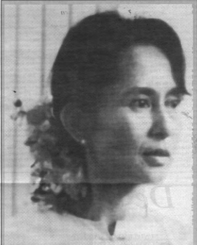
Aung San Suu Kyi

streeksteeng is het niet Slorc die heftig protesteert tegen de lokale Amerikaanse sancties, maar de Europese Unie. De Europese Commissie noemt de wet op de selectieve aankoop van Massachusetts een overtreding van de afspraken binnen de wereldhandelsorganisatie. "Het doel is wel juist, niet het middel", antwoordt Hans van Mierlo, minister van Buitenlandse Zaken van Europees voorzitter Nederland. Naar aanleiding van de Europese klacht stuurde Bill Clinton vorige week een delegatie hoge ambtenaren naar Boston, de hoofdstad van de 'lastige staat'. Zij moeten Massachusetts ervan overtuigen hun wet op de selectieve aankoop af te voeren. De volksvertegenwoordigers van de Staat en de gouverneur denken daar echter niet aan. Die beropen zich op een democratische beslissing. De stap van Washington lijkt dan ook meer op een poging om Europa te