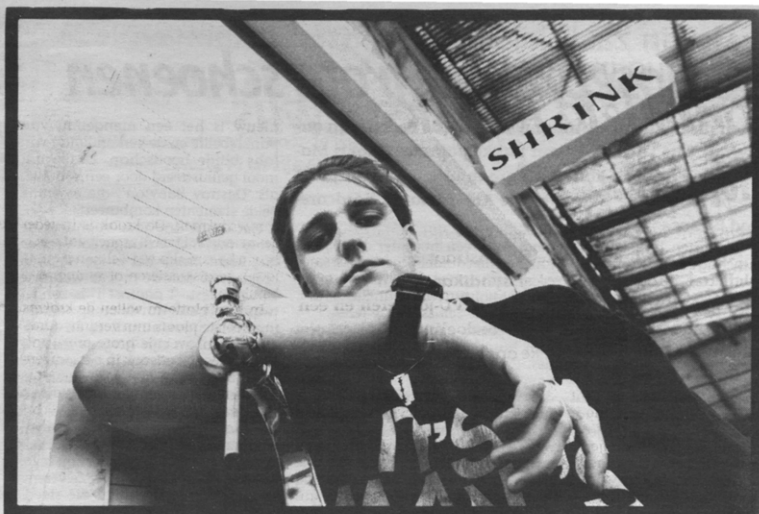
De laatste tapper

Tot op de dag zelf zag het er ook naar uit dat de Shrink langer zou kunnen openblijven: tot 15 mei volgens sommige bronnen, anderen spraken van 1 juli. Informeel, maar ook op de Almvagadering, werd er beloofd dat, ondanks tegenstand van de Technische Dienst, alles in het werk zou worden gesteld om de afbraak ten vroegste op 15 mei te laten beginnen. Er werd geargumenterd dat zelfs die datum praktisch niet haalbaar is, al was het maar omdat men dan met de afbraakwerken midden in de blok zou beginnen en de studenten van het Romerhuis daar wel eens serieus last van zouden krijgen.