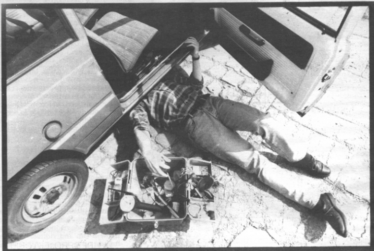
Recycleer zelf uw auto

Een informatiebrochure en een kalender met de data van de verschillende ophalingen zijn te verkrijgen op het stadhuis of op de milieudienst, tel. 22.21.14 of 23.45.67.