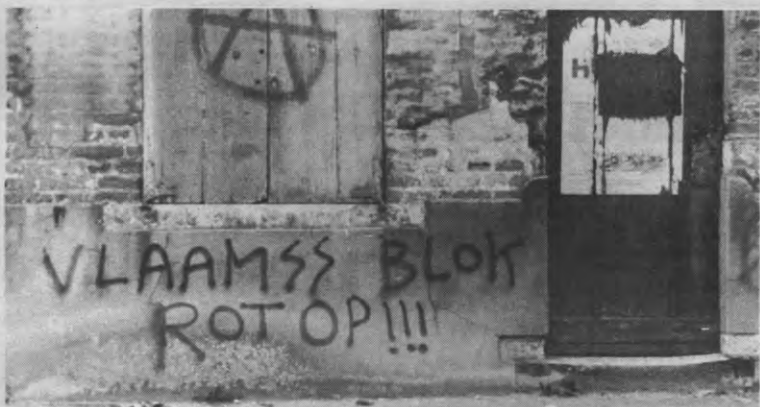
Vander Velpen: "Je kan de opgang van het Blok niet stoppen door hen dood te zwijgen."