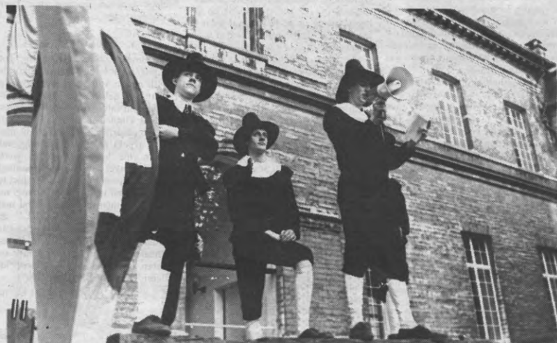
RECEPTIES zijn er om je te laten vollopen. En dan mag Massehelein speecheen, mogen zelfs een handvol rare kwisten de megafoon (recht uit de betogingen van deze winter, net zoals de Vlamsterdammers) hanteren, luisteren doet geen mens.