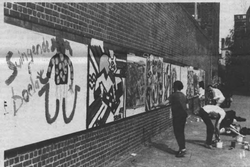
ALMA II — De plaatsen voorbehouden aan de studenten toonden soms pijnlijk dat je van schilderen toch wel wat kaas gegeten moet hebben voor je de vierkante meter leegte kan doen vergeten. Rond Leuven's eethuisnummer twee viel het nog mee (Woeha, de Louis), bij Economie was het huilen met de pet op — geen foto dus.