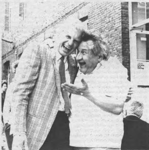
Shrinks onder mekaar.

Redaktievergadering: iedere vrijdagmiddag om 15.00 u.