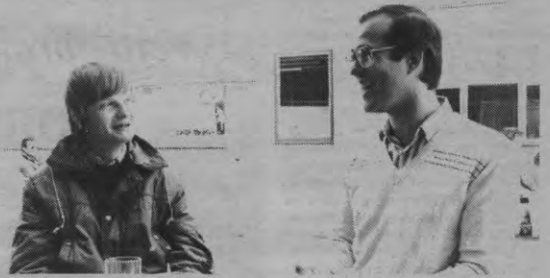
Twee leden van Historia's viermanschap: een expliciet pro-ASR-programma.