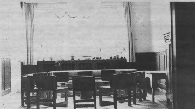
Op zaterdag 5 mei viert het Leuvense Steinerschooltje in de Zwarte Zusterstraat het lentefeest. Het schooltje wordt praktisch volledig gefinancierd door de ouders. De meubelen en het speelgoed in dit kleuterklasje zijn allemaal gemaakt door de ouders. Er wordt ook speelgoed verkocht om geld in het laatje te krijgen.