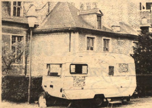
Om de eisen van de jongerenmars kracht bij te zetten organiseerde het doppersatelier een kettinghongerstaking. De hongerstakers worden om de 24 uur afgelost in deze karavan.

Wie belangstelling heeft voor de werking en acties van het Doppersatelier kan langlopen in de Brusselsestraat 65. De karavan met de hongerstakers bevindt zich op het binnenplein van het cultureel centrum even voorbij het St.-Pietersziekenhuis op de Brusselsestraat naar de markt toe.