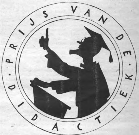
De drie beste profen van elk jaar kregen van Medika een speciaal ontworpen oorkonde waarin dit embleem was verwerkt. Daarbuiten kregen de besten van elk jaar nog een kunstwerk.