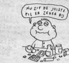
(De cartoons werden geleend uit Palfijn)

Tijdens de eksamenperiode staan de sociale diensten van de KUL ter beschikking van de studenten met problemen. Volgende week komt Veto uitvoerig terug op de faciliteiten die er geboden worden.