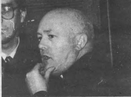
Kardinaal Danneels op de uitreiking van de eredoktoraten op 2 februari 11.

Veto: Arielezen zullen zeggen dat de kerk eerst bepaalt wat schuld is en ze daarna vergeeft, dat dit een kringredenering is, waar alleen de kerk beter van wordt.