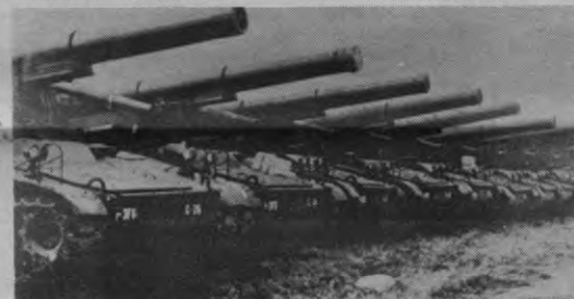
"Daarom zullen de Cruise Missiles en de Pershing-2 naar mijn mening West-Europa niet nog meer beveiligen..."

1. Wij hebben nu reeds de mogelijkheid de SU verschillende malen te vernietigen om, zo nodig, een aanval op ons te beantwoorden. De MX-raketten, de Trident 2, en de Pershing 2 bieden ons de mogelijkheden om praktisch zonder verwtigging de centrale strategische krachten van de SU aan te vallen.