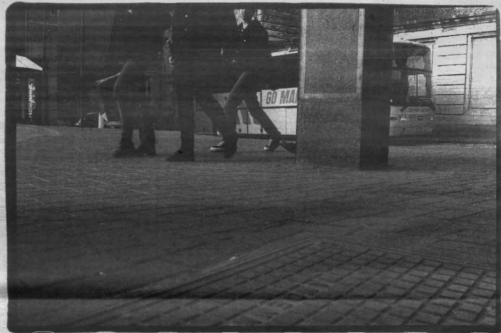
Loucheplein, klare dag. Geheim onderhoud ter sabotage van straatfuif. Ni dieu ni maitre werkt aan tegenoffensief, de telefoon plakt aan zijn oor.

Dat men al sponsors had aangesproken voor het evenement maakt de weigering er alleen maar pijnlijker op. De zaakvoerster die gratis skeelers ter beschikking zou stellen, merkte lakoniek op dat "er in Leuven toch niets mag met klein wielekes". Blijkbaar is het dus moeilijker om een straatfuif te houden dan een braderie, want dan vormt de Tiensestraat voor de stad eens-