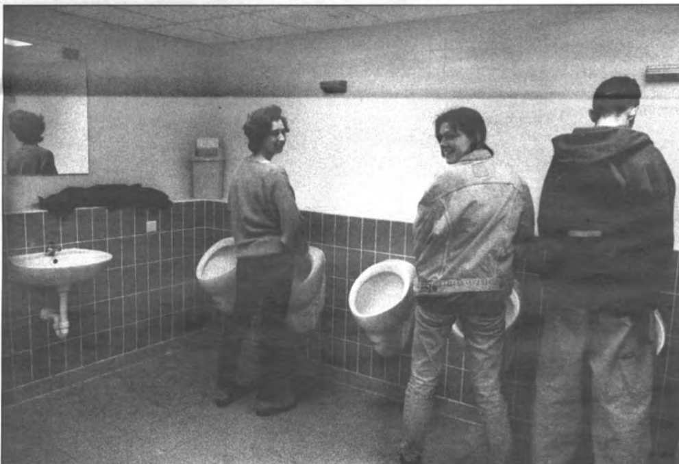
Wetenschap lost eeuwenoude frustratie van de vrouw op: eindelijk heb ik ook zo'n lul. Kijk eens hoe ze stralen.

De redenen voor dit geringer engagement van vrouwen in Loko zijn niet duidelijk. Willen, kunnen of durven zij minder