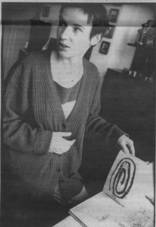
Tekst en tekening. Koek of krakeling. Het is een tweevuldigheid die geen tot schelden bedwingt. Het is de stem die zingt maar het is de klank die klinkt.