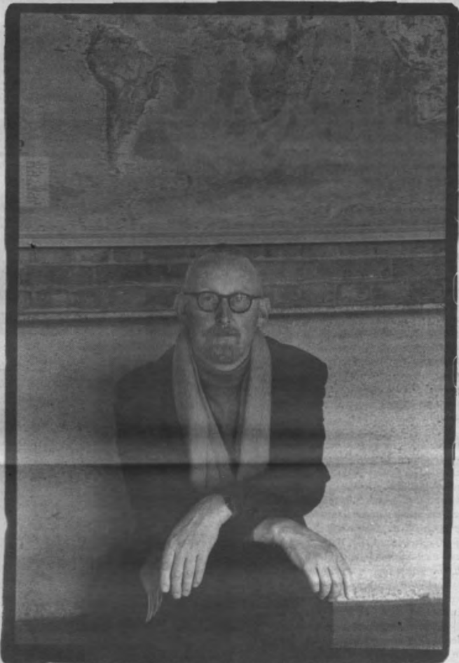
God schiep de zee, ik verkoopt zee. Geen kunst toch.

«Ik lok met mijn actie ook graag een maatschappelijke discussie uit. Dat lukt soms wel. Zo schreef iemand van een Nederlandse krant dat ik al mijn zee vooral niet