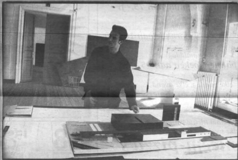
Vorm of vent, huis of haard. Ze zijn elkander waard. Bedaart, bedaart. Als het u niet bezwaart, één maak ik ze, dat zweer ik bij