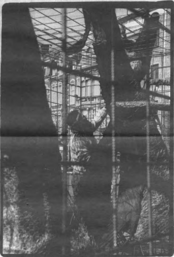
Lokinosaurussen op Ladeuzeplein moeten mannelijk reptielenbrein van Bergen lokken.

Het parcours van 'Nature Morte' is nog tot 23 mei elke dag te verkennen, van 10.00 u tot 17.00 u. Startpunt is het Cultureel Centrum Romaanse Poort in de Brusselsestraat. Daar krijg je een wandelroete, die je natuurlijk naar believen kan wijzigen. Individuele bezoekers betalen 200 frank, 150 frank is het tarief voor inwoners van Vlaams-Brabant, 26-mimmaars en 60-plussers.