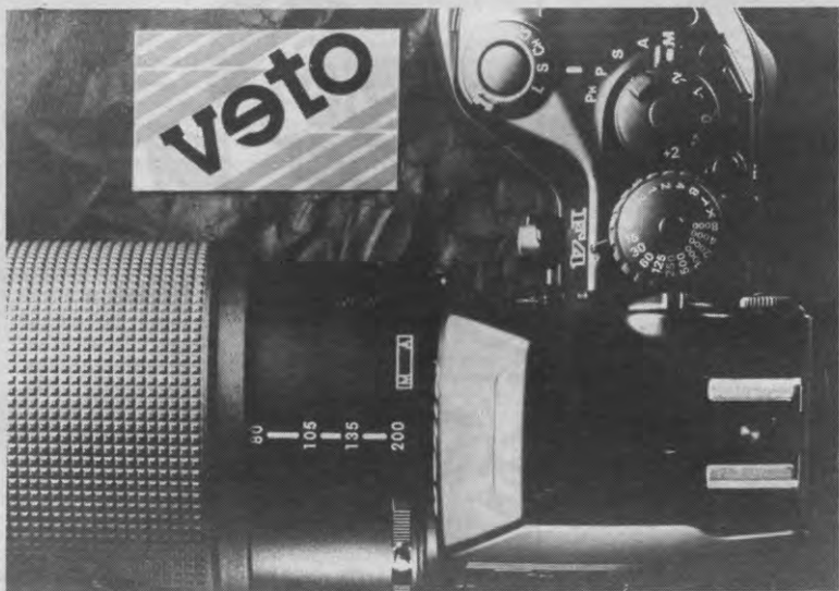
WERKVOLK - Als de lente in het land komt en de eerste Vetomedewerkers uitzwermen naar verre, zonnige stranden, is het goed in eigen hart te kijken even voor het blokken gaan. Dan roept ons moede hart om jonge, wakke zielen en drukken wij met graagte aan ons hart, lieden als daar zijn: schrijvelaars, tekenaars en plakkers, fotografen en zelduivels. Het leven kan u toelachen: torst samen met ons de zware last dezer publikatie. Wacht niet tot weer een maan verstreken is, want het volk staat nu reeds te drummen aan onze poort. De Goede God zal het u lonen.