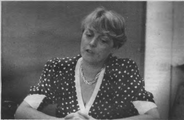
"Een mooie foto heeft niet het minste effect op de kiezer..."