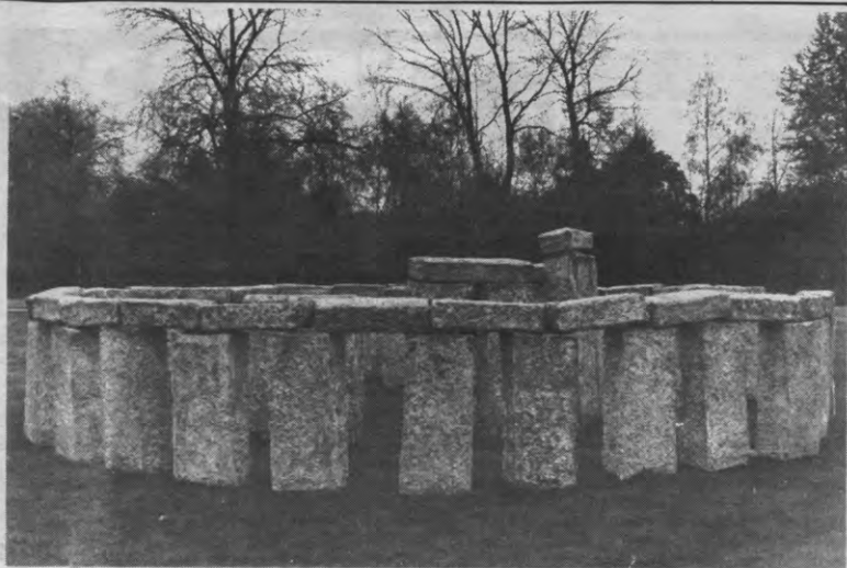
Een Burgie bouwt, zoveel is zeker. Dit Steenhenge bijvoorbeeld. In dit heidense tempelkompleks temidden van de Heverleese wouden vereert VTK voortaan de Heilige Barbara. Een emanatie van dit goddelijk kreaatur verschijnt trouwens al jaren regelmatig aan één van onze redakteurs.