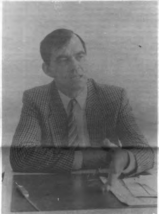
«De universiteit is voor mij nog een emanatie van burgerlijke structuren.»

dies marginaal beginnen te worden, verdwijnt geleidelijk ook hun betekenis. Voor diegene die frekwent gebruik maakt van Alma bijvoorbeeld, spelen de maaltijdprizen ergens wel door, met een verschil van een paar duizenden franken op jaarbasis. Alma kan de concurrentie met andere restaurants wel aan, maar heeft het al veel moeilijker in concurrentie met het zelf op kot koken. Als de gewoonte ontstaat bij veel studenten om zelf maaltijden te bereiden, dan zie je dat Alma-maaltijden een randverschijnsel geworden zijn. Sommige studenten motiveren het op kot eten omdat het goedkoper zou zijn dan in de Alma. Of het in uiteenlopende omstandigheden echt zo is, moet nog uitgemakt worden, maar men heeft alleszins de indruk dat het zo is. En dat is betekenisvol.»