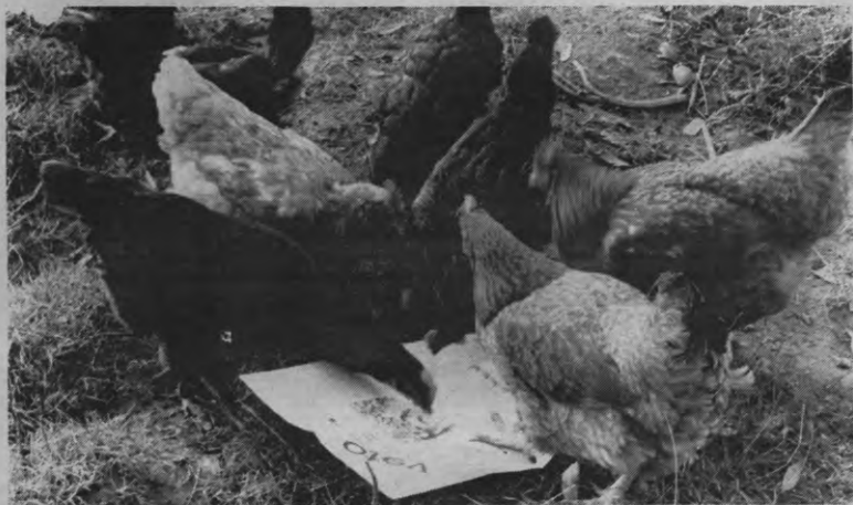
DE KNUPPEL IN HET HOENDERHOK - Zelfs de kippen kunnen hun wekelijkse Veto niet missen. Alleen: die stomme beesten weten niet dat dat blaadje niet gelegd maar gemaakt wordt. Als het je iets zegt om te scharrelen tussen de beroemdheden van onze aarde is de job van fotograaf iets voor jou. Wanneer je daarentegen meer houdt van kakelen op een blad papier, moet u redakteur worden. Je kan bij ons ook iets oppikken over tekstverwerking en fotocompositie, en ook het nobele lay-out werk kan je van stok houden. Kortom: iedereen kan bij ons zijn ei kwijt. Leg ze.