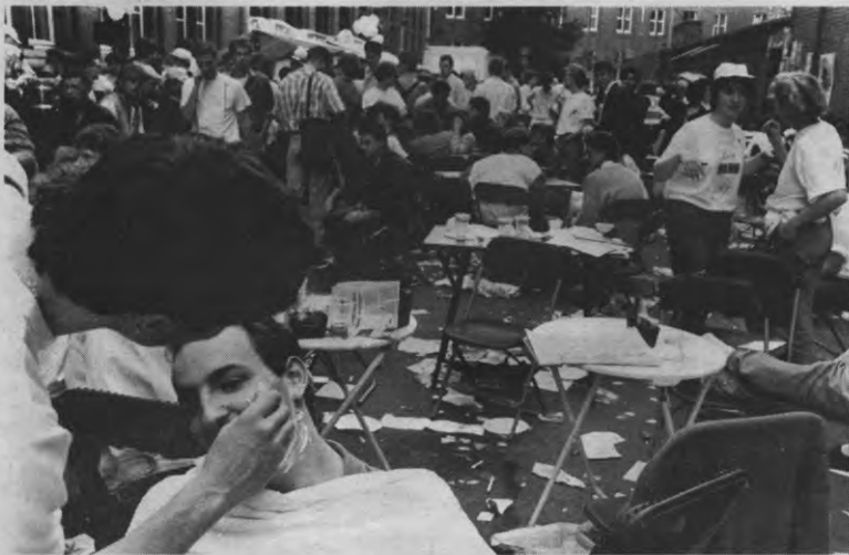
Ploeg ABC scheerde de economen een "charmante managementlook". Kop eraf?