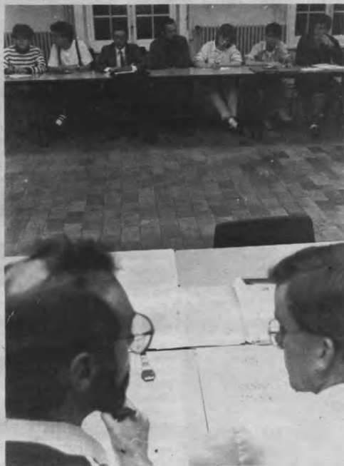
De vergadervoorzitters steken de koppen bij elkaar. Veertig vertegenwoordigers vragen om beurten om het woord.