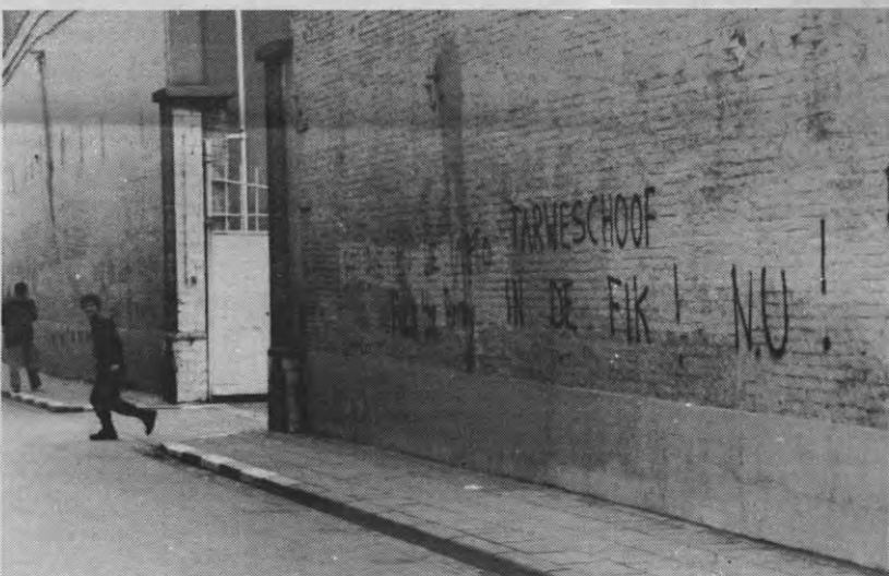
Het had in Leuven kunnen gebeuren: uit de NATO-kazerne 'De Tarweschoof' komt een militien buiten met geheime documenten over het militair-wetenschappelijk onderzoek aan de KUL onder zijn arm. Hij verdwijnt ermee, richting Heverlee, terwijl op de achtergrond een medewerker van de Vlaamse Vredesuniversiteit graffiti spuit. Maar Veto lag op de loer.

4. Maar er is nog iets anders. Veel intrigerender — want met veel meer vraagtekens — is het wetenschappelijk onderzoek waarvan de militaire bindingen niet zo evident duidelijk zijn, maar waarvan je toch kan vermoeden dat ze er wel degelijk zijn.