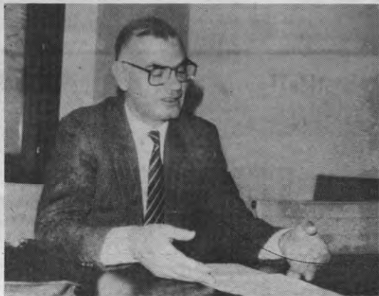
"Ik zie tal van bedrijven in heel nieuwe sectoren ontstaan; op dit ogenblik nog onderhuis."

Op onze vraag of hij geen breuk voelde tussen de golden sixties en de magere 80-er jaren, antwoordde de heer Van Waeyenberge dat er inderdaad in de meeste sectoren breuken zijn. De oorzaak ligt voor hem op een driedubbel vlak. Voorreest zit men in voortdurende herstruktureringen: 50%