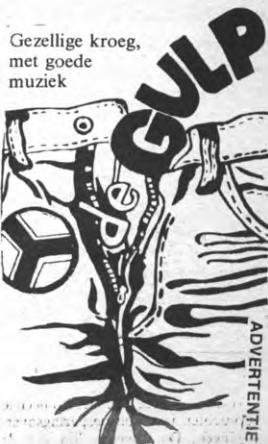
Gezellige kroeg, met goede muziek

De tentoonstelling van de ingezonden cartoons — die meestal tussen goed en uitmuntend schommelen — loopt van 27 april tot 11 mei, iedere dag van 8 tot 21 uur in Alma 1, tweede verdieping. B.RAM.