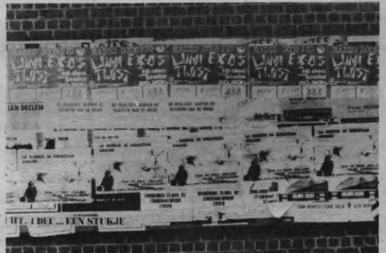
Art. 4 stelt dat het aanplakken van affiches op de openbare aanplakplaatsen van Leuven uitsluitend wordt gedaan door de stadsdiensten.

grond om iemand als mededader te beschuldigen op grond van het feit dat ook zijn naam op de affiche voorkomt, waarmede de 'private of de openbare eigendommen werd beschadigd', zoals in het geval van de drukpersmisdrijven de verspreider tegen de schrijver beschermd wordt, mogen we aannemen dat hier de schrijver tegen de 'destruktieve' verspreider beschermd is.