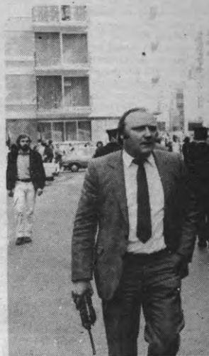
16 april: big brother's watching you.