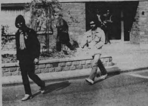
Het Kommando Hem-Day komt uit het arrondissementencommissariaat met de ontleende dossiers.