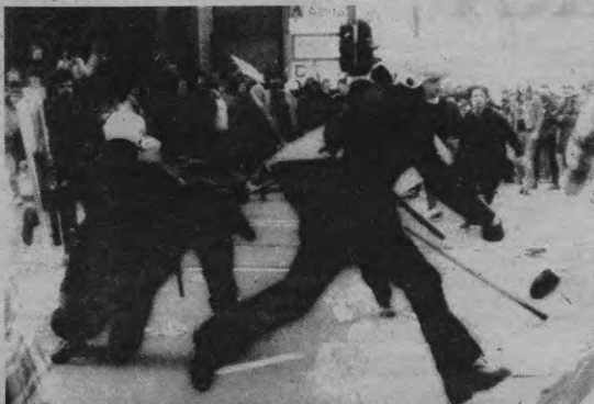
Danse Macabre van de Brusselse politie?

Ondertussen slaat de politie er niet naast. Er liggen enkele mensen te huilen op de grond, onder een regen van matrakslagen. De meeste 'autonomen' hebben zich intussen onder de 'betogers' gemengd.