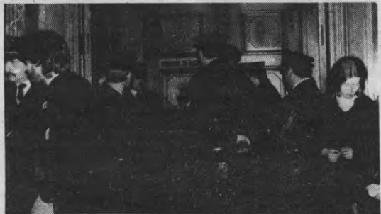
De Leuvense politie in het rechtsgebouw op 19/3, bij het eerste proces