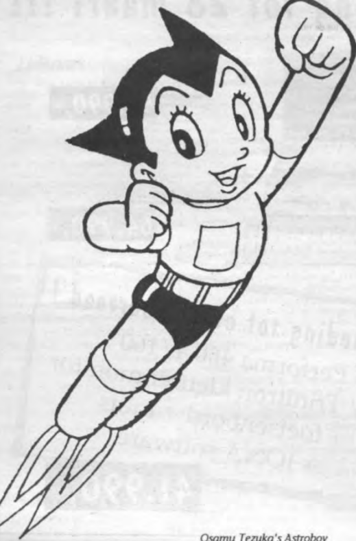
Osamu Tezuka's Astroboy