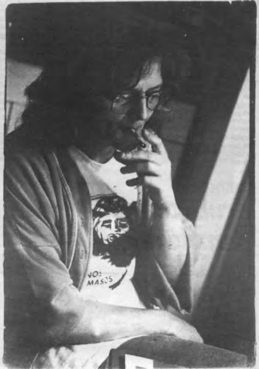
Plant boeren plant

"Tegen het einde van het jaar zou ik de legalisatie van softdrugs graag geïmplementeerd zien. Daarom zeg ik dan ook tegen de boeren: "Plant, boeren, we verliezen weer een seizoen." Al is