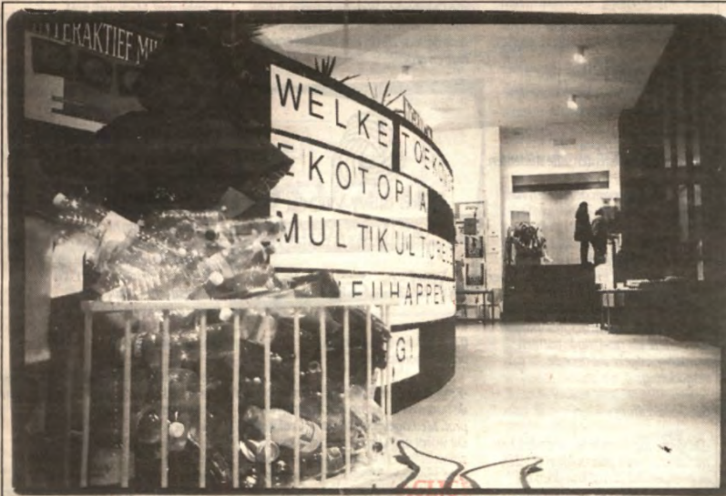
Vorige week woensdagavond stond in Alma 2 het milieu centraal. De 'multiculturele milieu-happening' heette 'Ekotopia' en u kunt er alles over lezen op pagina 3.