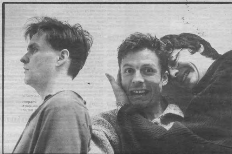
Kama en tweederde van Studio Kafka