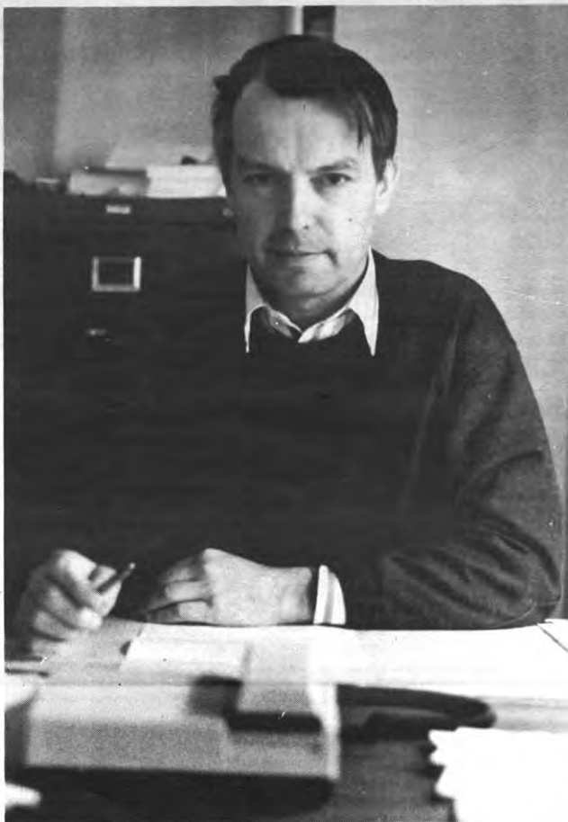
"De Kerk heeft geboeide handen door haar relaties met de Vatikaanse staat"

Veto: Hoe proberen jullie die mentaliteit van solidariteit en van het anders gaan leven over te