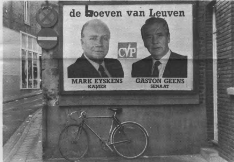
Onrechtstreeks komen uw inschrijvingsgelden misschien bij deze heren terecht. Ze geven het gelukkig zelf grip toe.