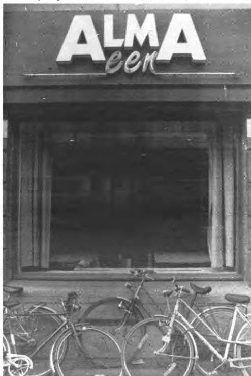
Misschien van Alma I een overdekte fietsenparking maken?