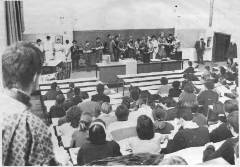
De VRG-ploegen pakt de zaken zo stuntelig aan dat de professoren in een hoekje naar hun tenen gingen staren.