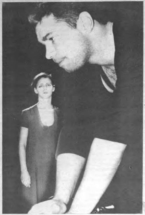
De Cocu op zijn grootst. De hoorns moet u er zelf bij denken.

aanwezig. De symboliek die met zijn ensenering gepaard gaat, duidt hem reeds van in het begin als een goochelende manipulator, de man die zowel het touw als de zotskap uit zijn mouw kan toveren. Als Bruno tegen Stella roept: "Vandaag wil ik of bedrogen worden of sterven. Jij mag kiezen: cocu of de strop!", dan is Estrugo hiervoor echter niet verantwoordelijk. De waanzin zit in Bruno zelf. Estrugo is wel medeplichtig, hij is de toeschouwer die niet zozeer beïnvloed door wat hij zegt, maar door zijn zwijgen. Hij onderneemt geen enkele poging om Bruno op andere ge-