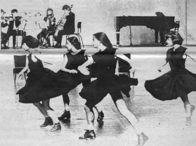
"In het begin is het behoorlijk wennen, en dat is geen kwestie van het al dan niet dragen van bottines."