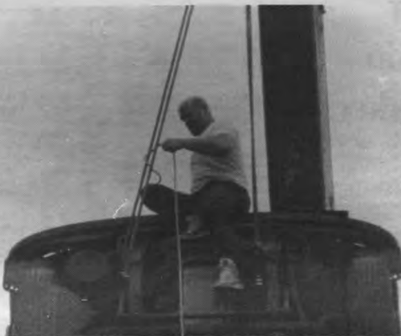
Stunt: Om het kiesvolk te behagen besloot deze kandidaat zich maar op te hangen.