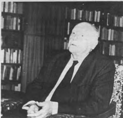
In de cosmos is er meer orde dan wanorde, anders was er geen wetenschap mogelijk.