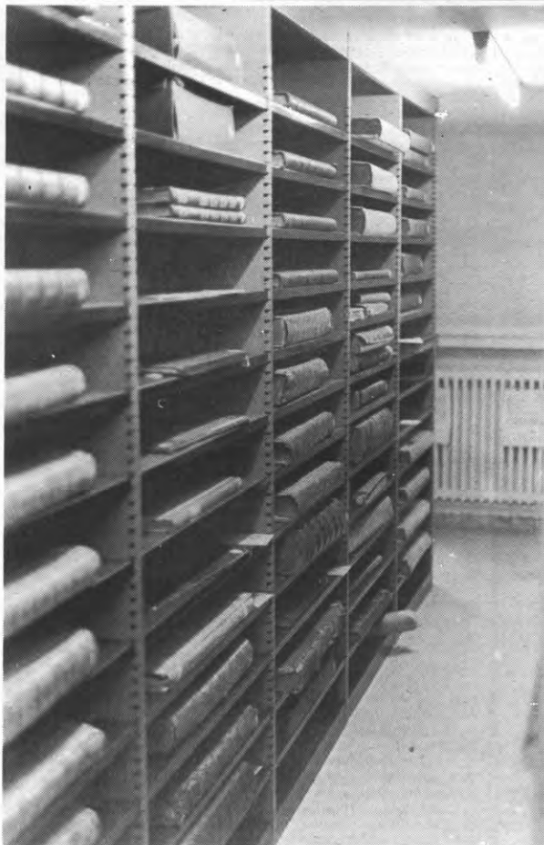
“Een dure kollektie atlasen, voor de geïnteresseerden