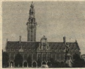
Alles over het bibliotheekwezen aan de KUL: p. 5, 6 en 7.