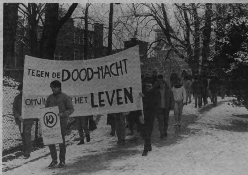
In stille optocht trokken de studenten GDW door het stadspark naar Alma II om te protesteren tegen de waanzin van de kernbewapening.