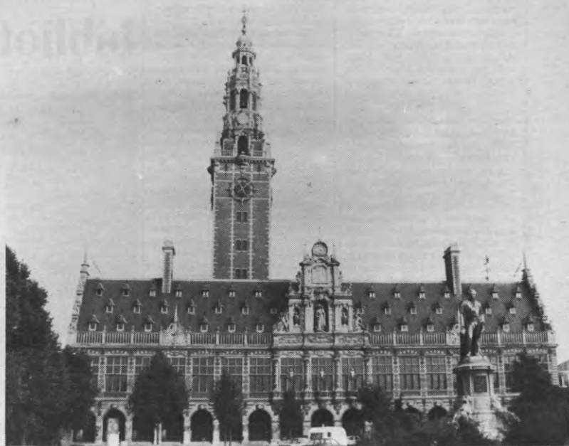
De universiteitsbibliotheek: een oord van rust, een tempel van wetenschap, een oase in Leuven.

Er zijn dagen dat ik op het Ladeuzeplein ga staan: het oud-gedige ge-