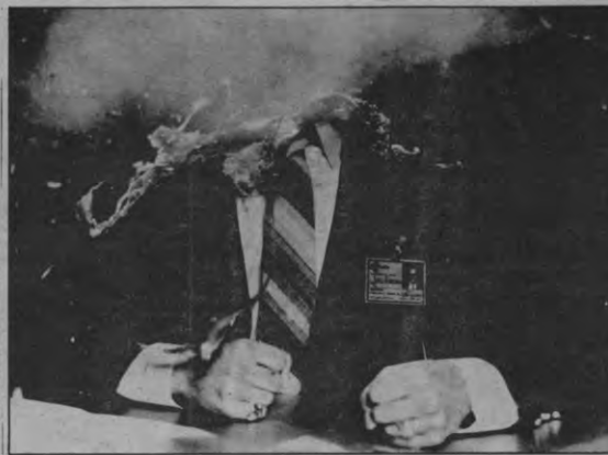
Don't loose your head. De rijkswachtercomputer bewaart het.

Ten tweede. Het belang van de registreerder staat duidelijk voorop, wanneer je dat vergelijkt met het belang van de geregistreerde. Dat leiden de onder-