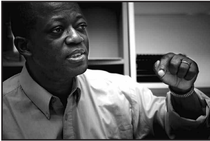
"Louis Michel doet er alles aan om te doen geloven dat Kabila de beste kandidaat is."

Banyingela: «Ervoor zorgen dat de ambtenaren een correct salaris krijgen. Zij zijn de ruggengraat van de staat, als je hen betaalt, dan geven ze er ook iets voor terug. Daarnaast is het belangrijk om de infrastructuur