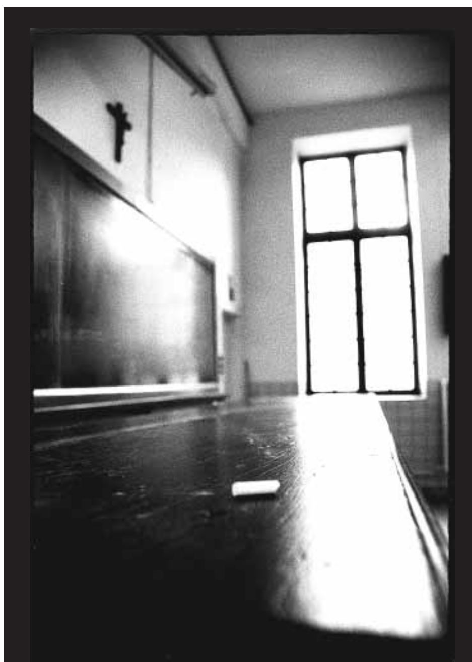
Het moet maar tegen 2010 afgerond zijn, maar Veto brengt nu al een katern over de Bolognaverklaring. De achtergronden, de standpunten, de toekomstperspektieven en natuurlijk ook het ding zelf leest u op pagina's 7 tot 10.