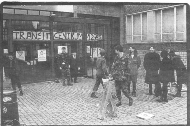
Goedgekeurd en Vlaamsch

Jan-Frans Lemmens Dimitri De Maesschalck