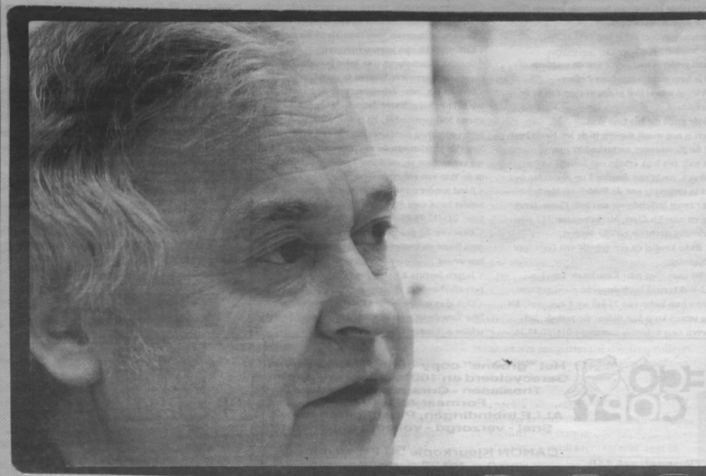
Was uw mama een kikker?