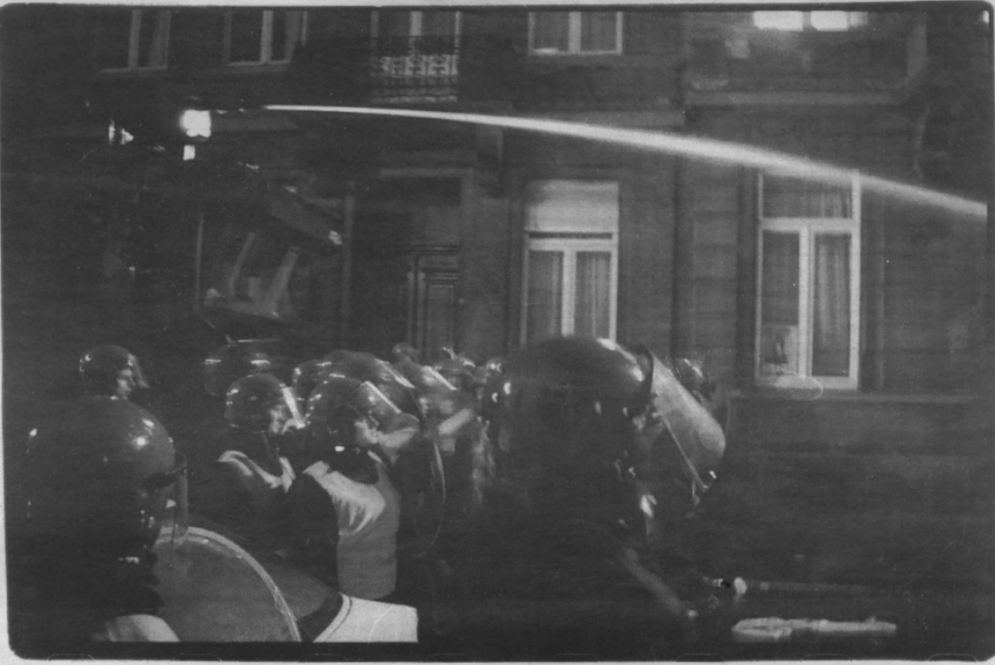
De vredespijp geblijft