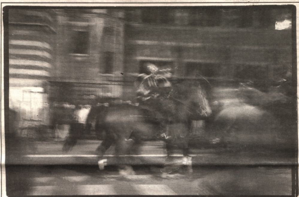
Het zag bruin van het volk in Leuven donderdagavond. Dat de tegenbetogers de NSV'ers overklasten in kwaliteit en kwantiteit is een grote troost. Het verslag van Veto's oorlogsjournalisten lees je op p.4 en 5.