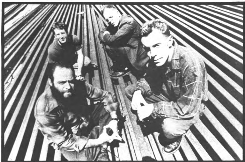
Lungfish op het droge.

ALFASET: S'MEIERSTRAAT 5, LEUVEN 016/22.04.66