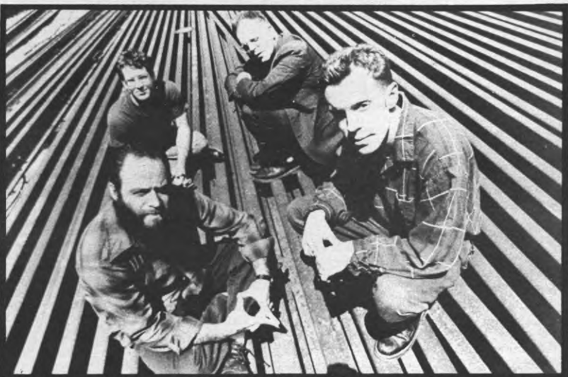
Lungfish op het droge.

ALFASET: S'MEERSSTRAAT 5, LEUVEN 016/22.04.66