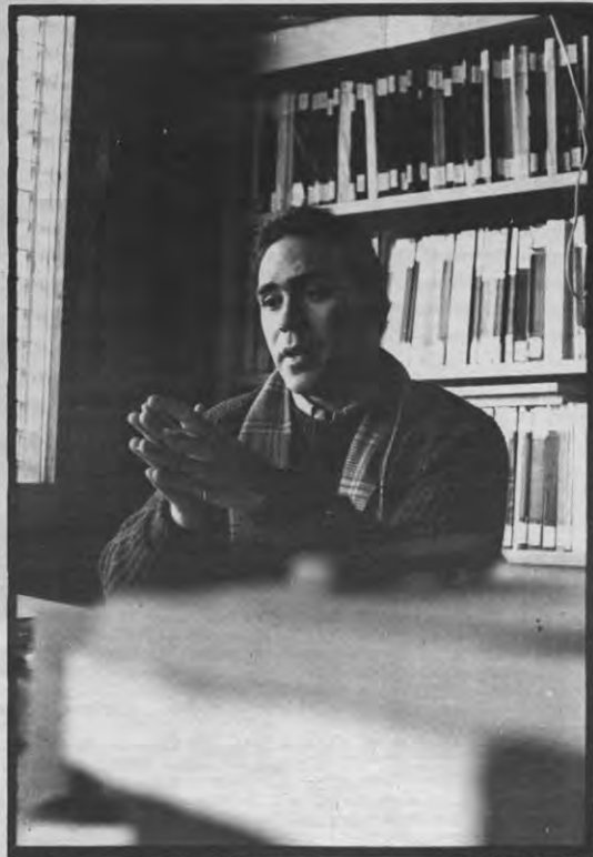
Wat heeft die tussen zijn vingers zitten?

Arawjo: «Er zijn inderdaad mensen die dat denken. Ze baseren zich daar-