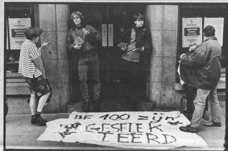
Numerus clausus om de Alma binnen te geraken?

De enquêteformulieren voor de grote Scorpio-enquête vind je in de Alma's, 't Stuc, 't Records, L&W, de Shrink en Politika. Scorpio rekent op de medewerking van al zijn luisteraars!