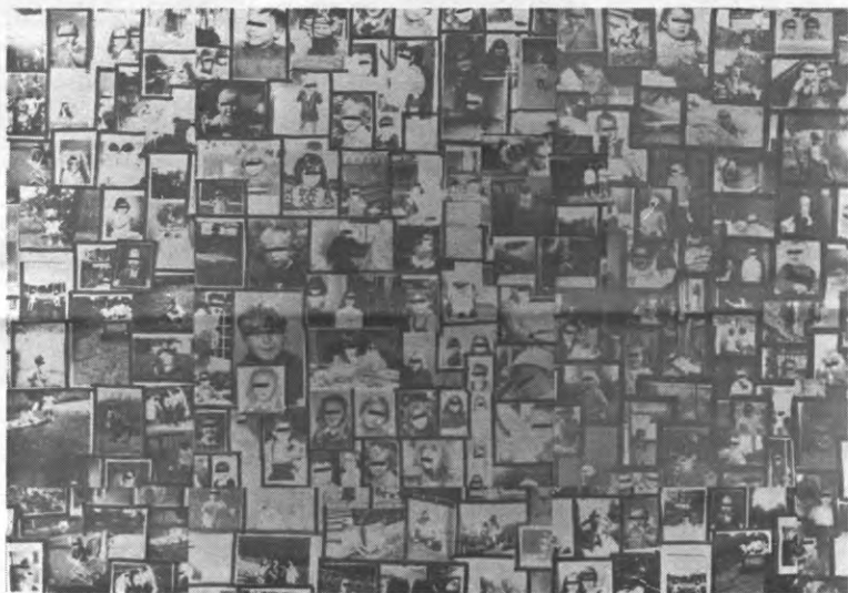
De kinderfotokollage van Jef Geys: misschien hangt jouw foto er ook tussen.