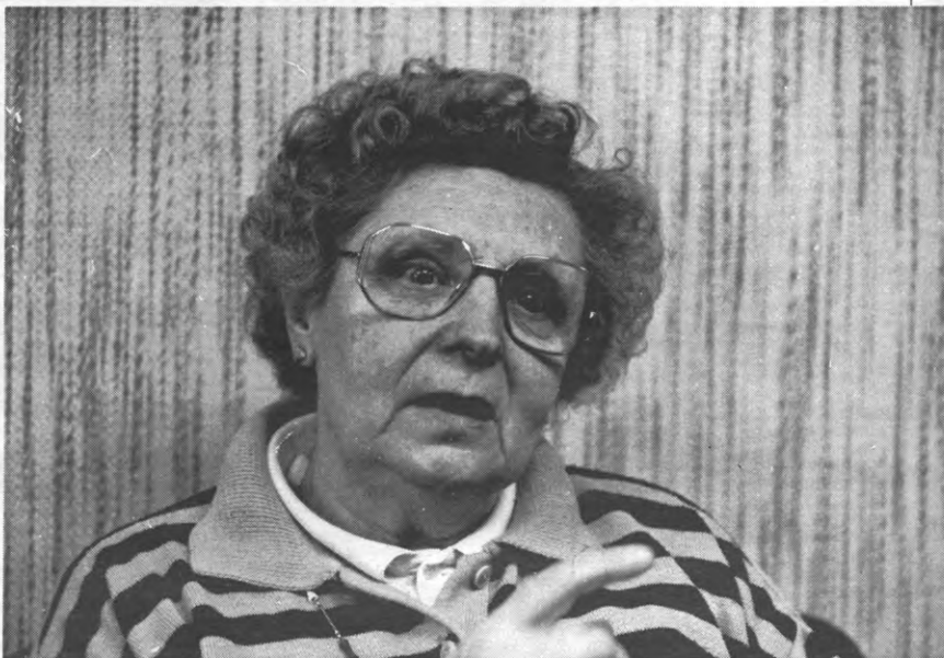
"We sporen de studenten wel eens aan als ze te weinig studeren."