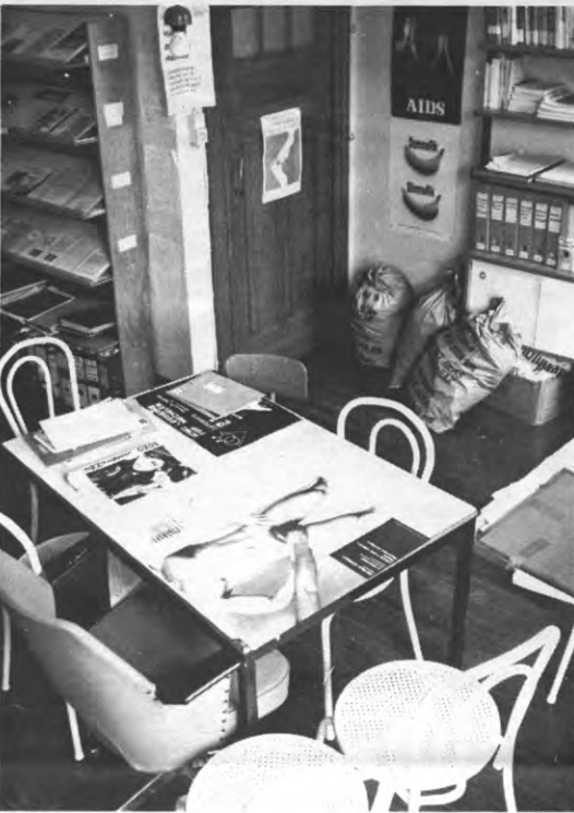
Momenteel liggen bij de Drempeel gewichtige beslissingen ter tafel.