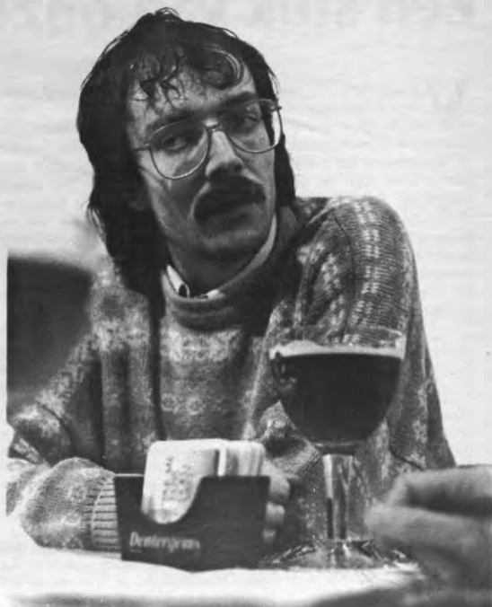
Bigband: rare snuiters die graag jazz deuntjes spelen?