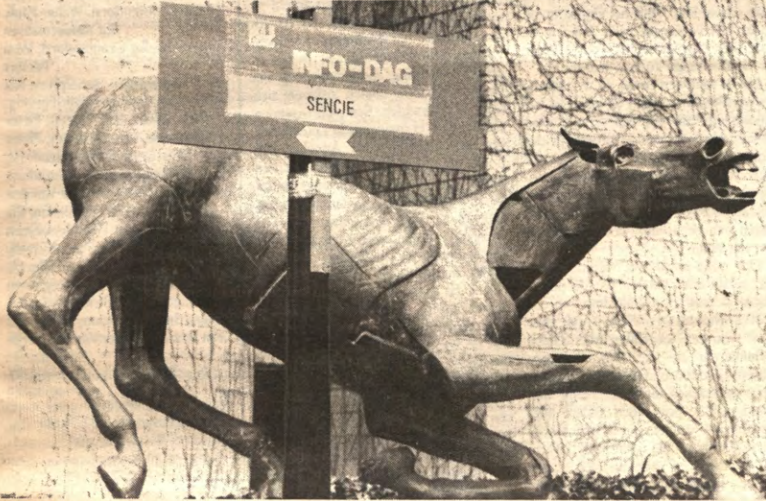
Uit het Trojaanse paard aan de burcht van L&W kwamen duizenden moedige krijgers om Leuven in te nemen. Ze brachten hun mama's en hun papa's mee en verorberden veel gratis frietjes in de Alma.

STUDENTENWEEKBLAD VAN DE LEUVENSE OVERKOEPELENDE KRINGORGANISATIE - JAARGANG 17, 1990-1991, NUMMER 24, MAANDAG 18 MAART 1991