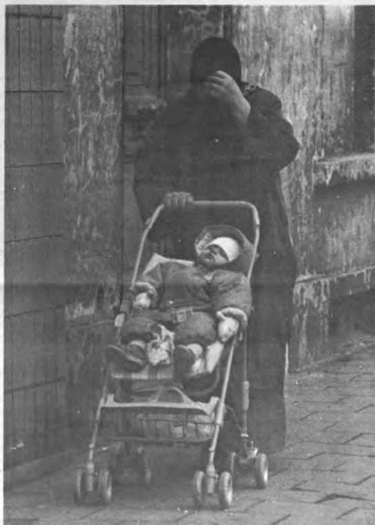
Een migrantenbrochure die zelfs door de allerjongsten geapprecieerd wordt. (Foto Archief).

Na een overzicht van het aantal vreemdelingen en Belgen in ons land, waarbij gekonstateerd wordt dat 'het migrantenprobleem' overroepen wordt, volgen een aantal levensverhalen van migranten met de bedoeling aan te tonen dat de levensstijlen van migranten zeer uiteenlopend zijn en dat men hen dus niet allemaal over dezelfde kam mag scheren. Er zijn er zelfs die werken en