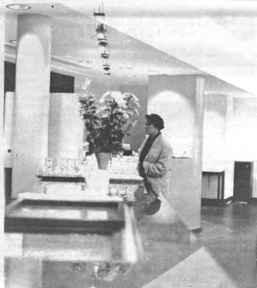
De politiek van de Almadirectie is ondoorgedrongen. Vandaag kost de cheeseburger met Marco Polo-saus 80 fr, morgen 77, overmorgen 81 en de dag erna misschien weer 79. Met wiens kloten wordt hier eigenlijk geramd?

twijfel de belangrijkste faktor van ongehoogen onder de studenten zijn.