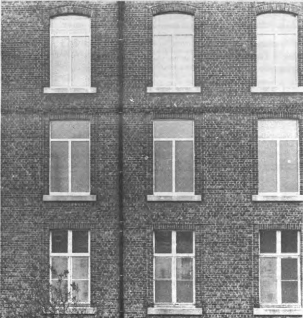
De universiteit zou veel meer moeten optreden als katalysator voor koten met ramen. De paters hebben het alleszins al begrepen: door het principe van de doorzichtigheid kunnen ze optimaal van hun huurders genieten. Loopt het al eens uit de hand, dan gaan ze te rade in de Sedes Sapientiae.

De studenten en de huisvestingsdienst brengen zich af of onze unief zich wel voldoende bewust is van de gevolgen van het kamertekort voor de demokrasisering van de universiteit. De speciale rol van de KU Leuven op dit gebied bestaat vooral in de zorg voor de huisvesting van studenten die het niet zo breed hebben en die geen kot kunnen betalen van 5000 frank. De KUL biedt zo'n 2500 kamers aan, ongeveer 15% van het totale kameraanbod. Veel te weinig om effectief invloed uit te oefenen op de priveekamermarkt, die op dit moment gemiddeld meer dan 5200 frank bedraagt. De KUL heeft slechts half zoveel kamers als wettelijk toegelaten is.