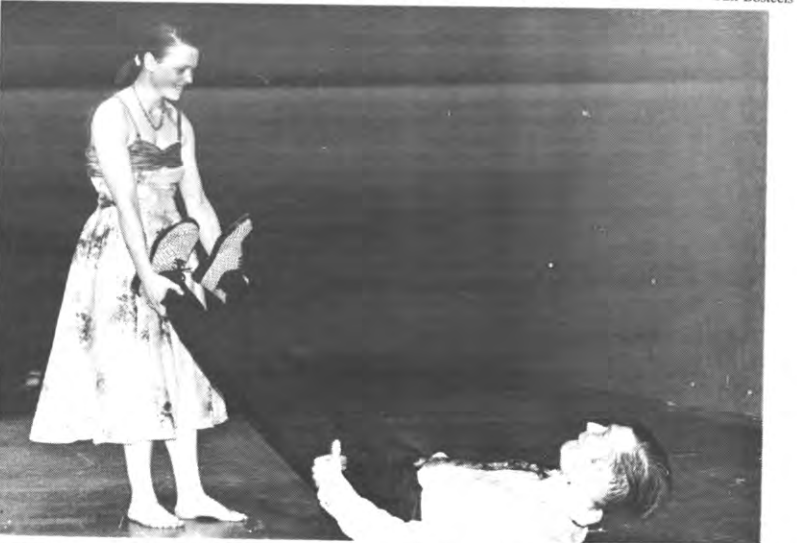
Verleiding en geilheid gaan niet altijd samen. Een beetje geweld kan wonderen doen.