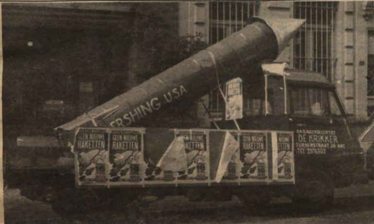
De bewapeningswedloop wordt gekenmerkt door een knap staalje newspeak: vroeger noemde men het 'nieuwe raketten bijzetten', tegenwoordig heet het 'ons arsenaal moderniseren'. Betogen dus.

Leuvense Overkoepelende Kringorganisatie Verantw. Uitg.: Carla Rosseels 's Meiersstraat 5, 3000 Leuven Tel.: 016/22.44.38 Verschijnt niet van juni tot augustus