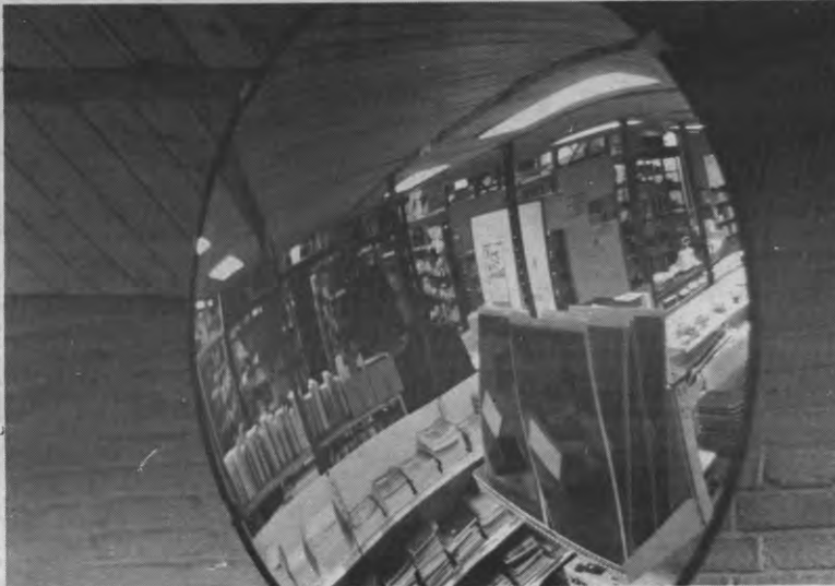
Het bewijs is er: Veto geeft een vertekend beeld van de feiten. Zeg nu zelf, had u uit deze verwrongen weergave ooit het Acco magazijn kunnen opmaken als wij het u niet gezegd hadden? Nee, natuurlijk niet. U dacht dat het moderne kunst was. Gefopt.