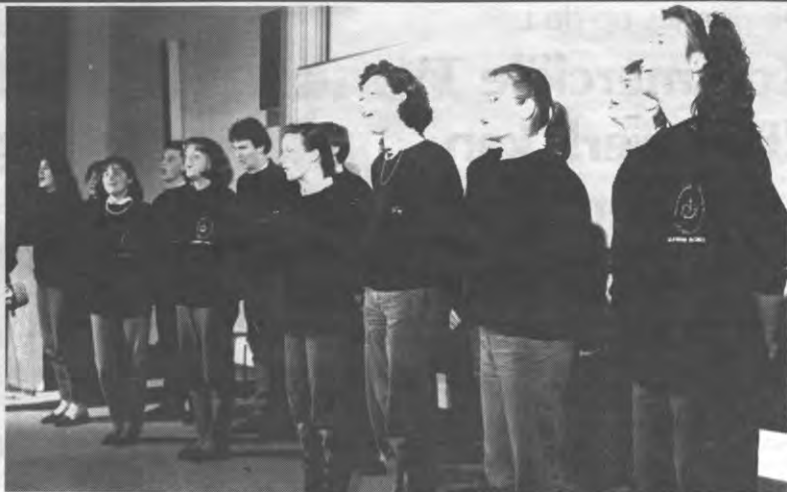
Jus is lekker als je braadt met Solo. Tweedle dee, tweedle dum.