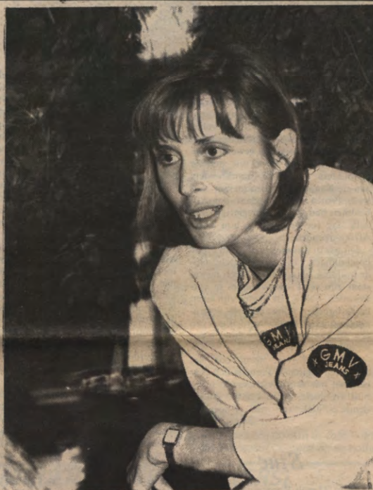
Ik wil niet de vedette zijn van mijn eigen programma.

Is politiek opium voor de bevrijdings-teologie? Is de CVP een katholieke partij? Gaat Van Miert stiekem naar de ochtendmis? Verspreide Mao zijn rode boekje of hostietabletten? Zijn dit stomme vragen? Heel wat serieuzer (helaas) gaat het er aan toe op bladzijde 6: Kerk en Politiek.