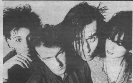
Claw Boys Claw moet het hoogtepunt of het "oorgasme" worden op de trash-rock avond in 't Stuc.