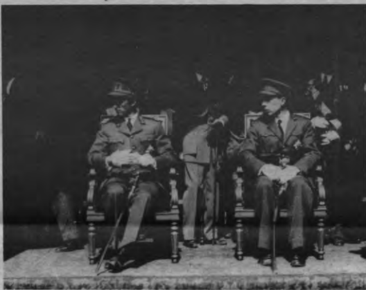
Uit onze archieven diepten we nog deze foto op van Leopold III (links) en prins Karel (rechts). Om welke tennismatch het ging, stond er niet bij vermeld.

M. Vanden Wijngaert, Een koning geloofd, gelaakt, verloochend. Acco, 1984, 71 + 135 blz.