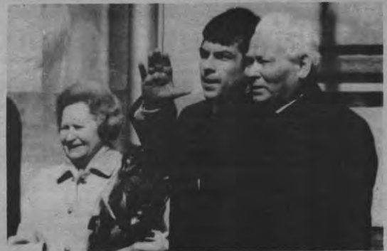
Nog nooit uw tanden gezet in een Entrecôte Tsjernenko ? Lees dan!

Verveling is het sleutelwoord voor wie de Sovjet Unie bezoekt. Niet dat de Russen onvriendelijk zijn; of de KGB alomtegenwoordig; of het eten slecht. Voor wie een beetje tegen vettig vlees