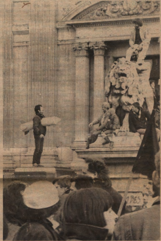
De rakettenbetoging in Brussel was een onverhoopt succes. Zoals je op de foto's kan zien ging het er zelfs vrij speels aan toe. Maandagavond was het dan weer een hels kabaal in Leuven. Meer dan 300 verontruste betogers lieten met potten en pannen hun mening horen omtrent de regeringsbeslissing in verband met de raketten. De organisatie, VAKA-Leuven, wil de komende weken elke maandag om 18.00 uur een dergelijke protestkreet laten horen.