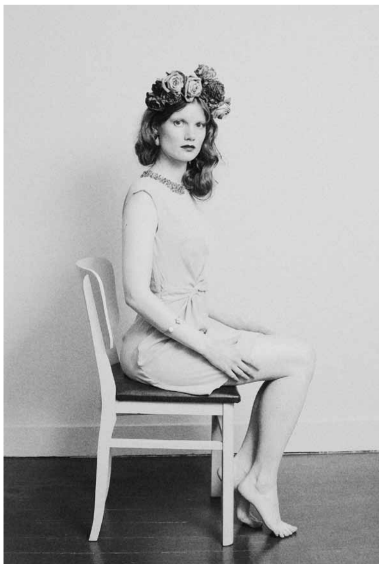
Me & Maria

Ondertussen heeft het initiatief al veel navolging gekregen en zijn er talloze pagina's op Facebook waar tweedehandskleding wordt verkocht. Doordat studenten vanuit heel Vlaanderen in Leuven komen studeren kun je op Louvintage mapjes vinden van mensen die eigenlijk uit West- of Oost-Vlaanderen komen, terwijl je de spullen op hun kot in Leuven kan komen ophalen.