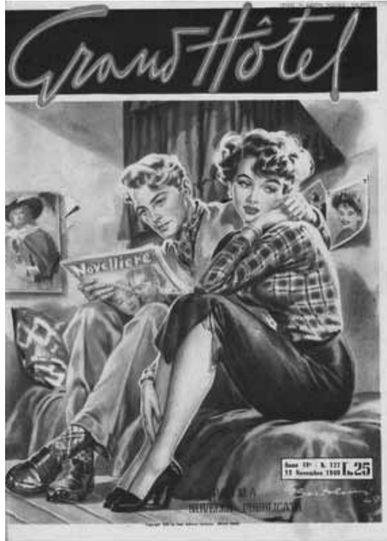
Website KU Leuven

De tentoonstelling “De fotoroman in alle staten” opent op 8 mei en kan vanaf dan t.e.m. 31 juli bezocht worden in de Centrale Bibliotheek in Leuven.