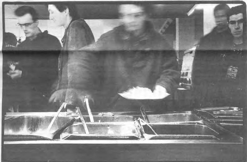
Met de trein was je er al