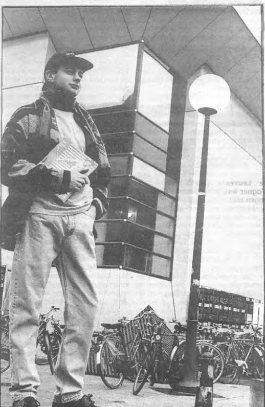
De toekomstige intelligentsia