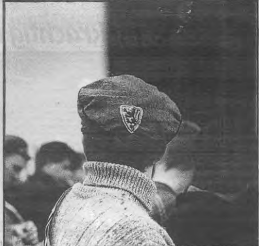
leg 99w Ze zullen hem niet stemmen

Als grote voorbeeld werd door Dutoit de onafhankelijkheidsstrijd van de Basken en de Koerden aangehaald. Meervoud was volgens Dutoit overigens als tijdschrift begonnen uit een "nood aan objectieve berichtgeving over de ontvoogdingsbewegingen in die landen" en was aanvankelijk bijna uitsluitend gericht op buitenlandse