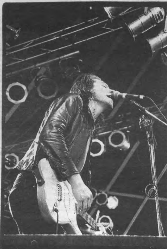
Komaan zuigeling, zuigeling, schud je heup

In het zogen dEUS genieten ook andere Vlaamse bands mee van de mediabelangstelling. De Evil Superstars, wiens debuut-cd verwacht wordt tegen eind april en die te zien waren als support-act van dEUS in de Londense Astoria, kunnen zich verheugen op de interesse van een tiental platenlabels en bestuderen dezer dagen de beste aanbiedingen. Ook Soulwax, Soapstone en andere Nemo's