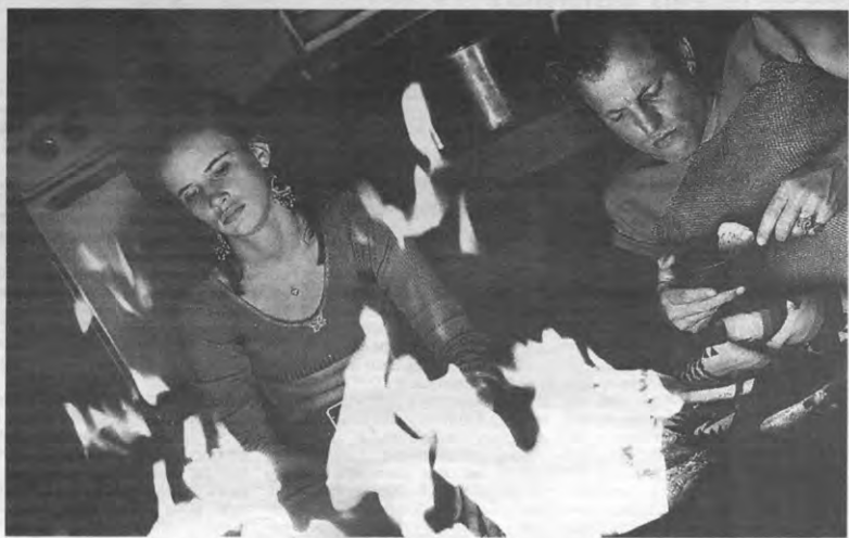
Kent er iemand een goede mop?

Meer aansluitend bij de visuele truukjes van Oliver Stone wordt op 20 maart een reeks video- en filmprogramma's vertoond van min of meer experimentele kunstenaars. Er is onder andere 'Remembrance of Things Past' van John Maybury, die ook het clipje draaide van Sinead O'Connors 'Nothing Compares 2U'. Zijn video-programma zou naar verluidt visueel overonderend zijn. Maar als u uw