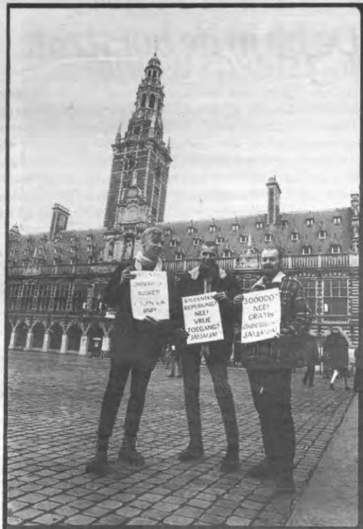
De rijkszwacht telde één betogter

Ook tegenover andere vormen van studentenbeperking zoals de gewogen loting in Nederland — je kans om uitgeloot te worden hangt voor een deel af van je resultaten in het middelbaar — stonden de kringen negatief. Vorige vrijdag gaven ze dan aan wat er volgens hen wel moet gebeuren. Ze vinden dat de begeleiding in de laatste jaren van het secundair onderwijs aanzienlijk verbeterd kan worden. De