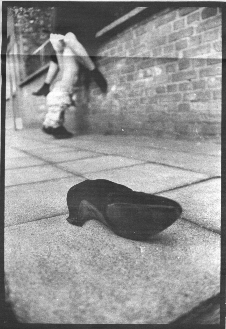
Twee straathoekwerkers in actie.