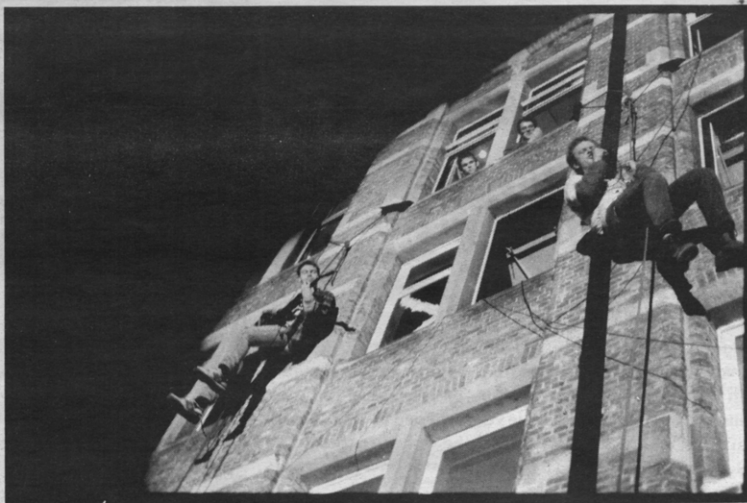
De mannen van Scorpio gingen voor de gelegenheid uit hun raam hangen en speelden een deuntje boerenrock.

Ithaka konfronteerde dus werken van professionele kunstenaars en van studenten met elkaar, en dat scheen ook dit jaar weer te werken. Zodanig zelfs dat het publiek niet wist wat nu wel of niet door studenten werd gemaakt. Van die andere konfrontatie die de organisatoren beoogden, met name die tussen beeldende kunst en muziek, was heel wat minder terug te vinden. Sommige werken hadden met muziek hoegenaamd niets te maken, hoewel dat wel het opzet van het hele project van dit jaar was. Het viel wel op dat muziek centraal stond in alle studentenprojecten. Bij sommigen ging dat wel heel ver. Zo was er een rockgroep die aan kabels hing en deden uit de ramen van de derde verdieping van Arenberg een concert gaf. Het beeldende aspect waren zij dus zelf. Het was een van die verrassende stunts die Ithaka dit jaar dat