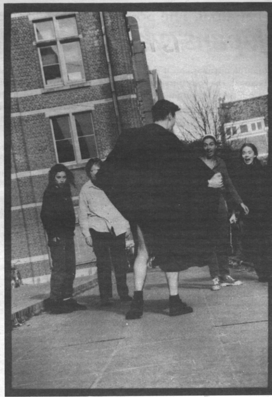
Ons beeld van de ekshibitionisten wordt sterk beïnvloed door stereotypen.

Er bestaat weinig georganiseerde hulpverlening buiten de strafrechtelijke sfeer. Ook de psychologische begeleiding van het slachtoffer is niet voldoende georganiseerd. Men heeft nog geen duidelijk beeld van de behoeften van de verschillende katego-