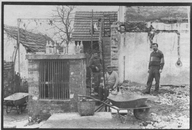
Heropbouw van een Kroatisch dorp na een bominslag.