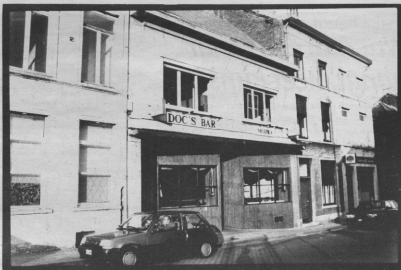
Volgens de organisatoren van de betoging stelt de horeka in Leuven zich allesbehalve loyaal op ten aanzien van de fakbars.

De eerste eis betreft het domiciliëringprobleem voor studenten. Het pamflet stelt dat de weigering om studenten toe te laten zich in Leuven in te schrijven een bedenkelijke praktijk is. Kris Van Poucke, vrijgestelde bij