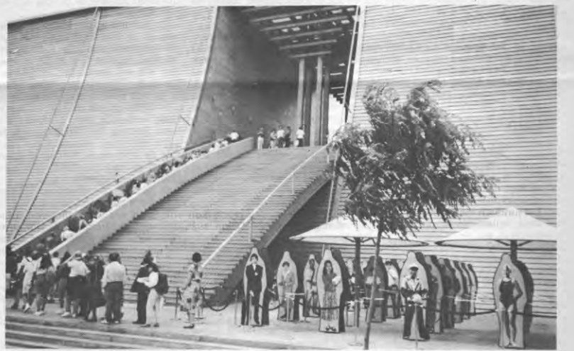
De wereldtentoonstelling als promotiemiddel van technische ontwikkeling is in wezen voorbijgestreefd.

Terwijl duidelijk niet iedereen van de Spelen profiteert, probeerde het stadsbestuur wel de hele bevolking achter het project krijgen. "Barcelona, som tots" ("Barcelona, dat zijn we allemaal") luidt het, en het beeld van de bewonderenswaardige Olympische vrijwilliger — wat een besparing! — wordt gebruikt om alle stedelingen tot een permanente inzet voor hun stad te bewegen. Deelnemen moet belangrijker zijn dan iets winnen. □