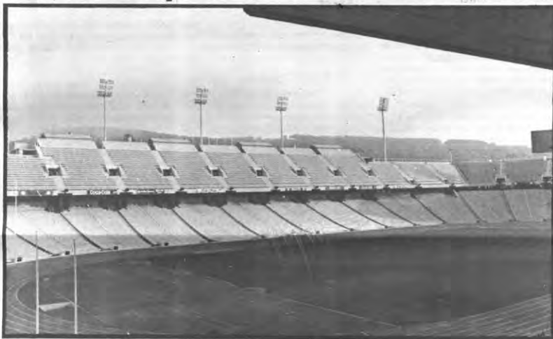
Het Olympisch Stadium in Barcelona, een prestigeproject zonder weerga