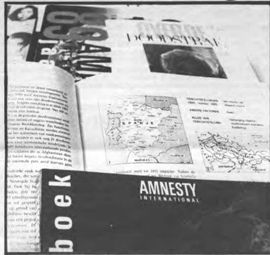
Ook Amnesty International is een aantal vieze zaken op het spoor.

De Wereldtentoonstelling van Sevilla (20 april — 12 oktober 1992) leidde begrijpelijkerwijs (zie artikel "Ontwikkeling van de periferie") tot een min of meer georganiseerde protest-beweging. Die kwam, in de dagen voor de opening, ter plekke uiting geven aan haar ongenoegen: geen betere manier om de miljoenen televisiekijkers en bezoekers te bereiken. Zo hadden de organisatoren het echter niet begrepen: met een brutale politierepressie ontzegde ze de beweging haar recht op vrije meningsuiting. De Spaanse staat en zowat alle media speelden het spel mee, zodat de schietpartij nauwelijks internationale weerklank kreeg.