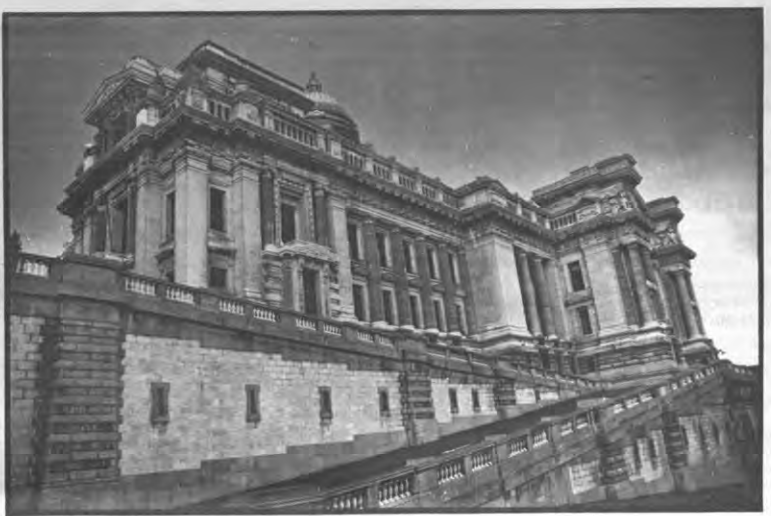
Administratieve rechtbanken als sluitstuk van een onafhankelijke rechtsspraak.