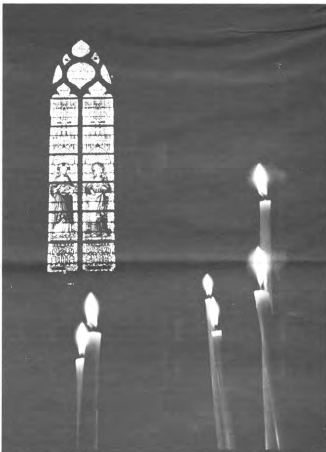
Kaarsjes branden voor de paus.