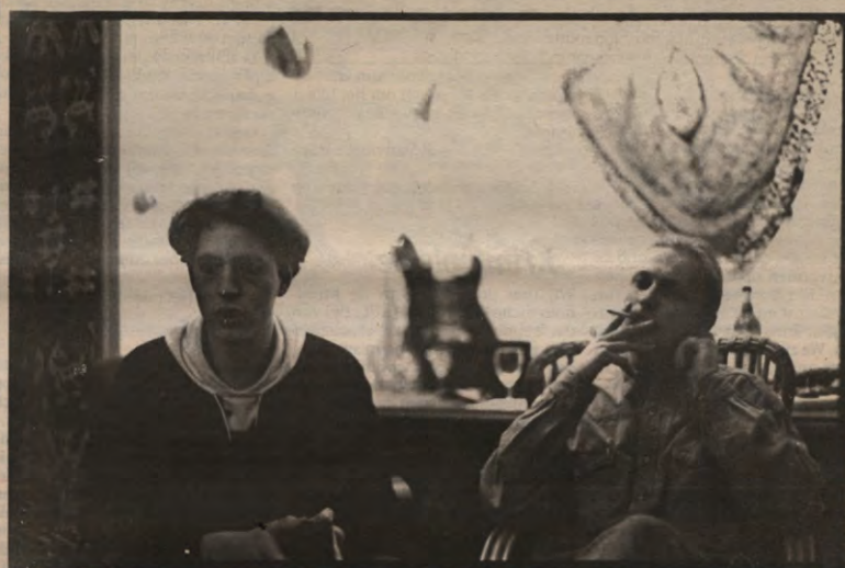
In onze vierde aflevering over concertorganisatoren gingen we deze twee poesjes uithoren. Cri du chat. Miauw, pagina 9.