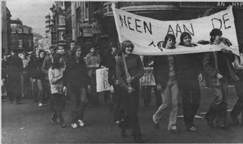
Een tijdsbeeld. De studentenmode van toen. 19 oktober 1978 blijft aktueel.