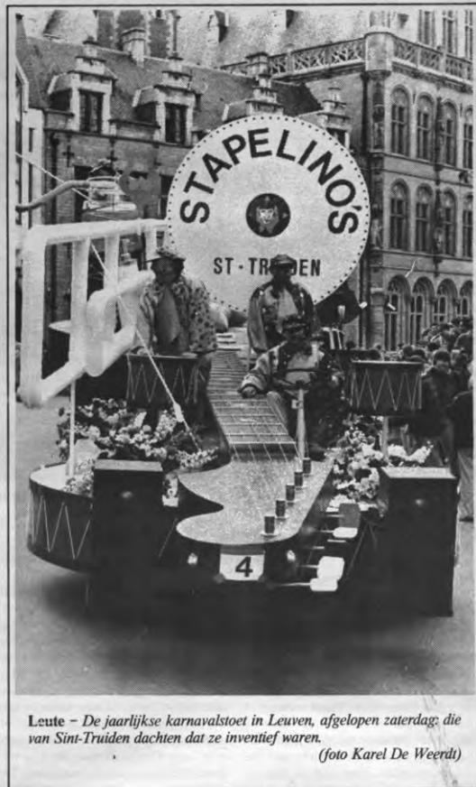
Leute - De jaarlijkse karnavalstoet in Leuven, afgelopen zaterdag, die van Sint-Truiden dachten dat ze inventief waren.

«Dat principe bestaat al lang. Toen Jean Gol geboren werd, verbleef zijn