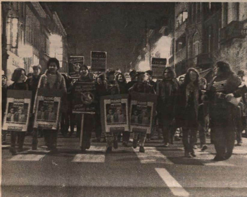
Op de jongste manifestatie van het ARF werd al duchtig gemobiliseerd voor 'Hand in Hand'.

STUDENTENWEEKBLAD VAN DE LEUVENSE OVERKOEPELENDE KRINGORGANISATIE - JAARGANG 18, 1991-1992, NUMMER 23, MAANDAG 16 MAART 1992