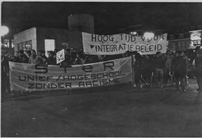
Is er sprake van democratie in een samenleving waar 10% van de burgers niet mag meespelen? (Weerdt)

saties en jeugd- en migrantenbewegingen, weigerden immers de discussies rond de platformtekst in het openbaar te voeren. Andere verenigingen konden slechts amendementen indienen die men bovendien niet mocht komen verdedigen. Het Leuvense Anti-Racistisch Forum heeft zo - tevergeefs - een tiental amendementen ingediend. Vanuit heel wat organisaties is bovendien kritiek geuit op de vaagheid van het platform. De organisatoren wimpelen die kritiek af, en stellen dat ze ervoor gekozen hebben om zich niet af te stemmen op progressief Vlaanderen, maar wel om over een zo breed mogelijk spectrum het grote publiek aan te spreken.