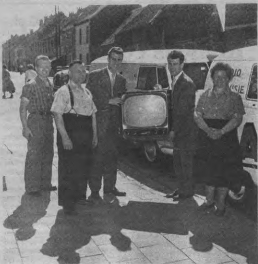
Het eerste televisietoestel in de straat. Komt dat zien. De stoute jaren kunnen beginnen.

Over de niet zo ruime opkomst maakt de Kultuurraad zich niet direct zorgen. Vorig jaar zouden er ook niet bijster veel mensen op de tentoonstellingen geweest zijn. En het Arenberginstituut ligt ook een beetje afgelegen, zegt Isabelle. Men heeft echter bewust voor Arenberg gekozen. Men zou dat veel mensen zouden kennismaken met dit gebouw. Mooi gewoon zegt de architect in onze redactie dan altijd, maar wij vonden er niet veel aan. (JVL)