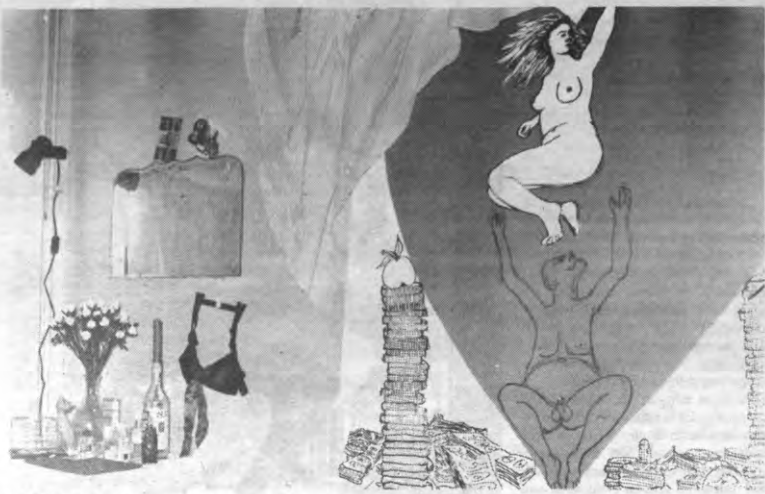
IS DIT het artistiek bordeel van een doorsnee architect? Welnee, Leuven ging gewoon even vreemd vorige week. Wild, lijkt het. Saai was het.