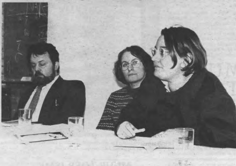
Waar staat de C van CVP nu voor? En wat heeft dat met verzuiling te maken? Onder andere daarover ging het op dit debat.