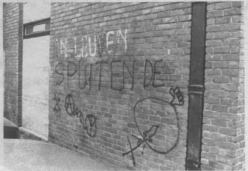
De muur volkladden kan ook esthetisch zijn. Dat is wellicht een van de ideeën achter "Muurtoerisme", het nieuwe AV-project van Kultuurraad dat doorgaat op 29 april.