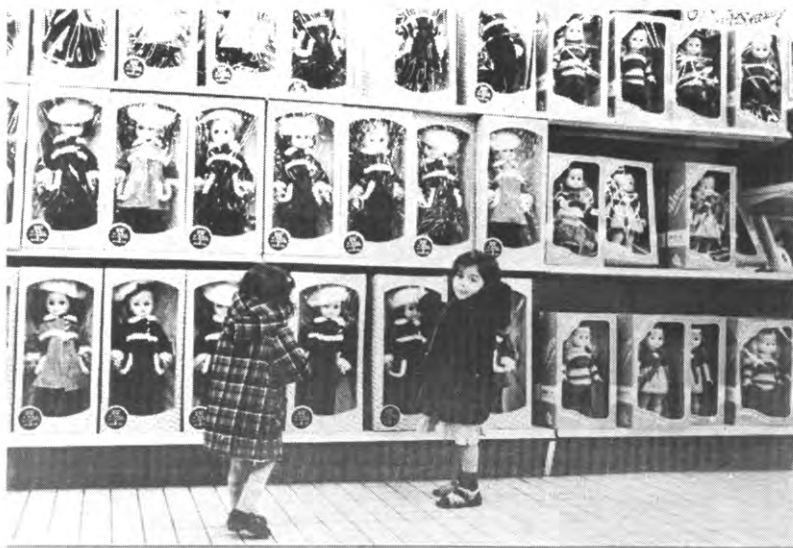
Schrijnende konfrontatie: de wereld van de rijken met die van de armen