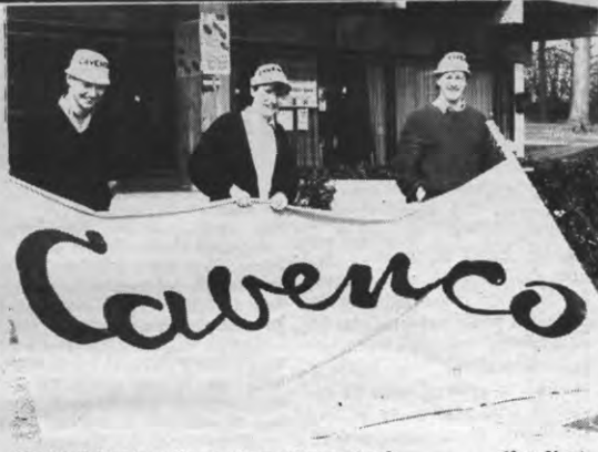
Wie heeft hier in godsnaam weer zitten spuiten?