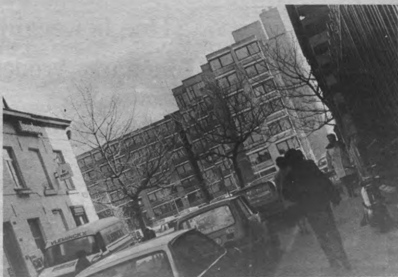
Nu de architect van het L & W-gebouw overleden is, dreigt ook zijn gebouw onder de kritiek te bezwijken