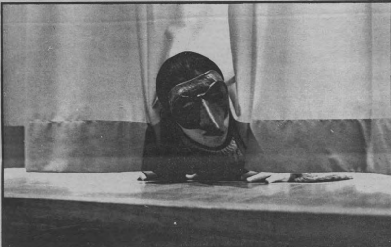
Effe zien, zit er al publiek in de zaal?