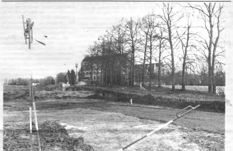
Groenveld: geen gras meer, maar des te meer addertjes.