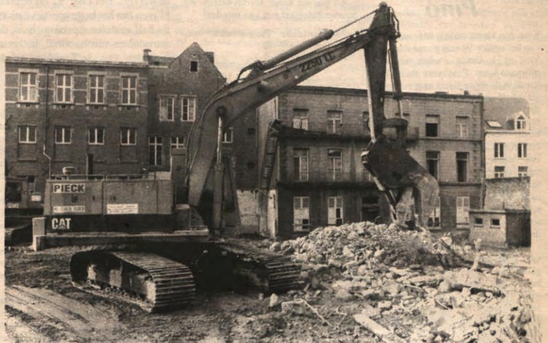
EKONOMIE - In vorig nummer berichtten we over de geluidshinder veroorzaakt door de bouwwerf van de nieuwe fakulteit Economie aan de Naamssestraat. Deze week schotelen we u de volledige plannen voor: pagina 5 gunt u een blik in de toekomst (vanaf 1994).

Deze en volgende weken stijgt Veto in elk geval af, en begeeft zich tussen het 'voetvolk'. We gaan praten met mensen die de universiteit vanuit een totaal andere hoek benaderen. De andere kant van de unief: op de achterpagina.