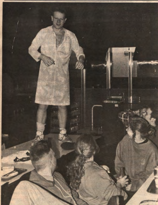
LISST - Vorige week had het Leuven Internationaal Studentensportnooi plaats in en rond het Sportkot. Ook in de kroegen natuurlijk, en in de Thierbrau. Hoe heel Europa, inclusief het GOS, zich onder de toeg sportie, leest u op pagina 2.