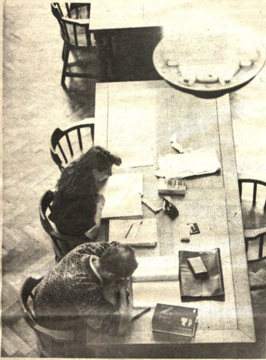
Meisjes leiden jongens al giehelend af in de leeszaal van de Centrale bibliotheek: slechts één van de talrijke degeneraties die de emancipatie heeft meegebracht