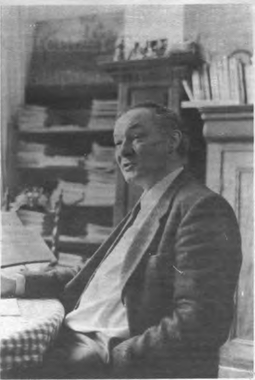
«Kotetentjes bij kaarslicht zijn zakenlunchen op amoeuere vlak.»

Veto: Sommige restaurants beperken hun aanbod op een andere manier: zij houden het bij vegetarisch eten.