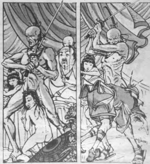
Het middeleeuwse Japan blijkt een vruchtbare inspiratiebron voor het obligate snuffe seks dat ieder stripverhaal altijd opnieuw weer bevat. Hier ziet u homofiele samoeraï, omringd door jonge knaapjes.