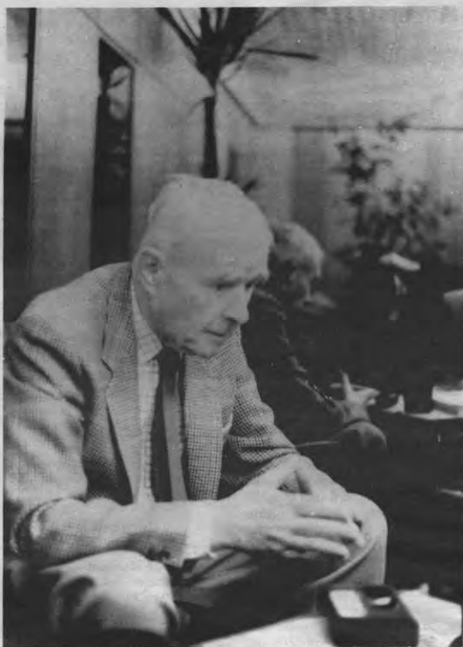
«Het IJzeren gordijn heeft geen historische, kulturele wortels. De Russen daarentegen behoren zeker niet tot de Europese kultuur.»

Veto: Maar kan men die niet-Europese stroming in Rusland, de slavofielen, dan niet beschouwen als nationalistien die tijdelijk de overhand haalden? Dene-